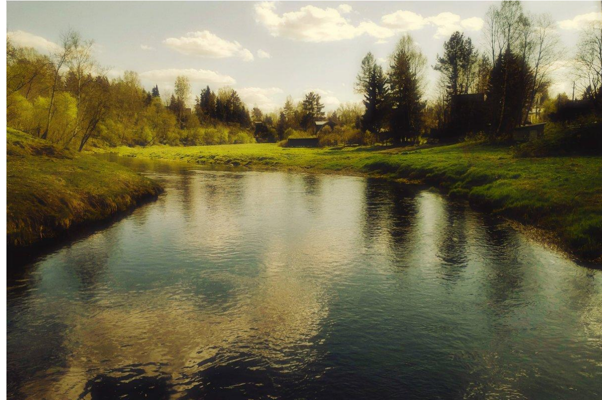
Вид с подвесного мостика через реку Мза

Мза или Мха, (Муза — топкое место, финское — рыхлая земля) — небольшой речке в болотистой местности, по которой во времена Петра I сплавляли лес, предназначенный для строительства Санкт-Петербурга.