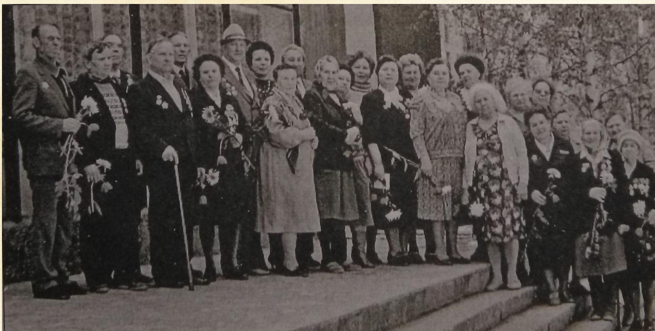
Ветераны Великой Отечественной войны ОГУП «Липецкфармация» (фото 1985 г.)

Более 40 фармацевтов Липецкой области приняли участие в Великой Отечественной войне. Они проходили службу в военных медицинских аптеках, аптеках медсанбатов, полевых госпиталей, эвакогоспиталей.