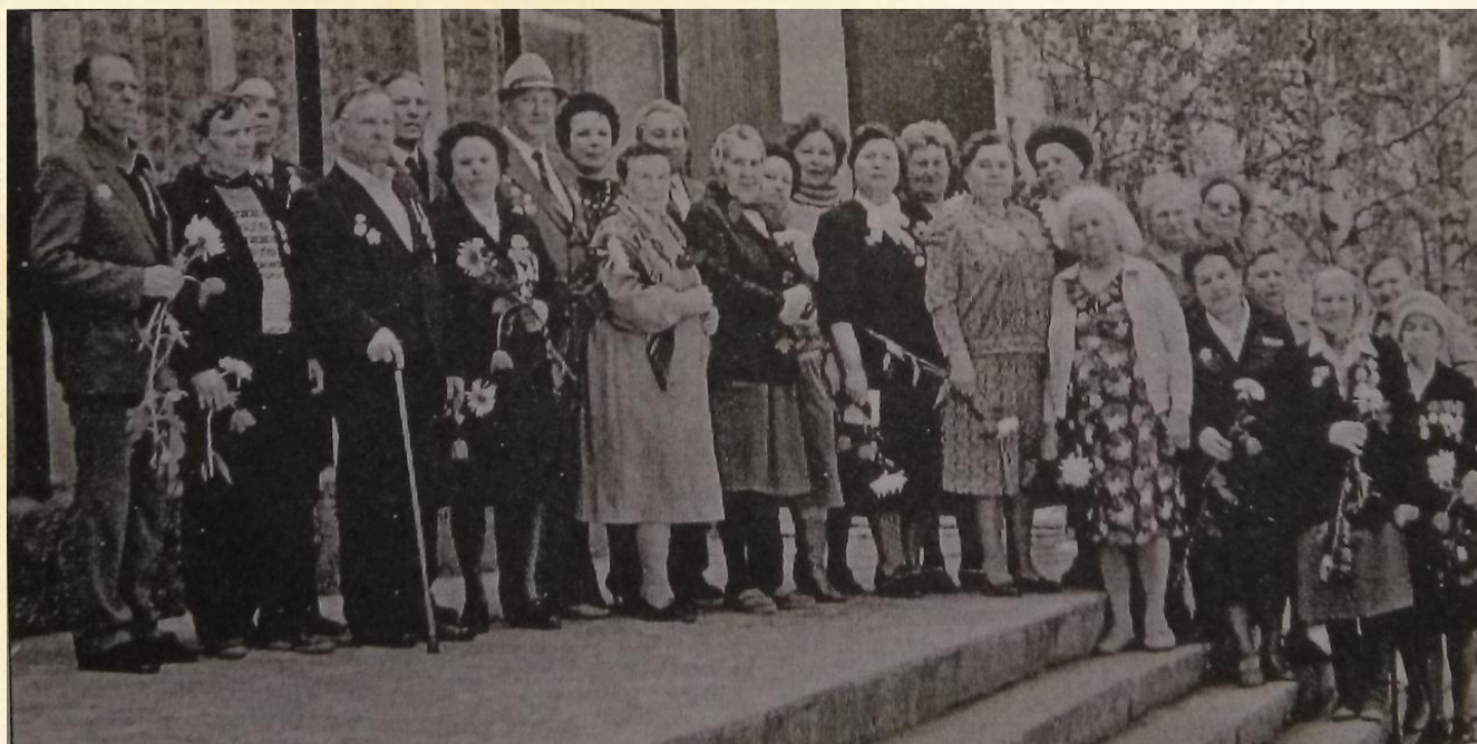
Ветераны Великой Отечественной войны ОГУП «Липецкфармация» (фото 1985 г.)

Более 40 фармацевтов Липецкой области приняли участие в Великой Отечественной войне. Они проходили службу в военных медицинских аптеках, аптеках медсанбатов, полевых госпиталей, эвакогоспиталей.