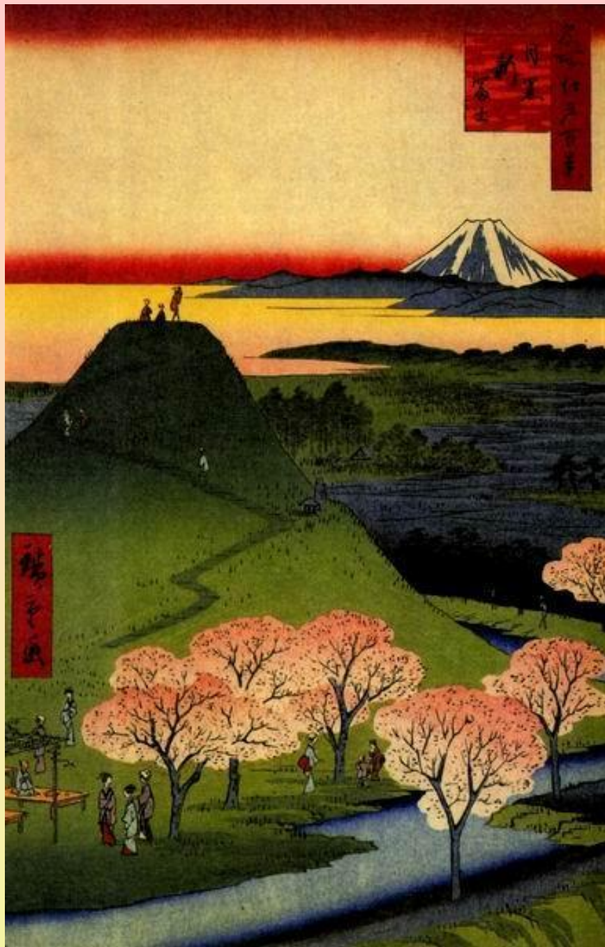
Андо Хиросиге – Мегуро Сан- Фудзи (Новая Фудзияма)