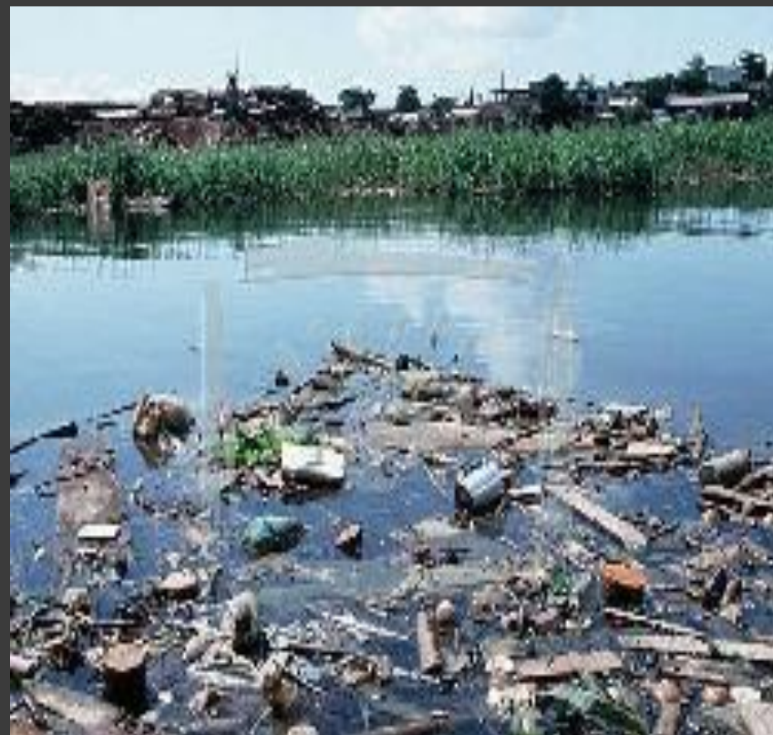
Загрязнённая река Цитарум