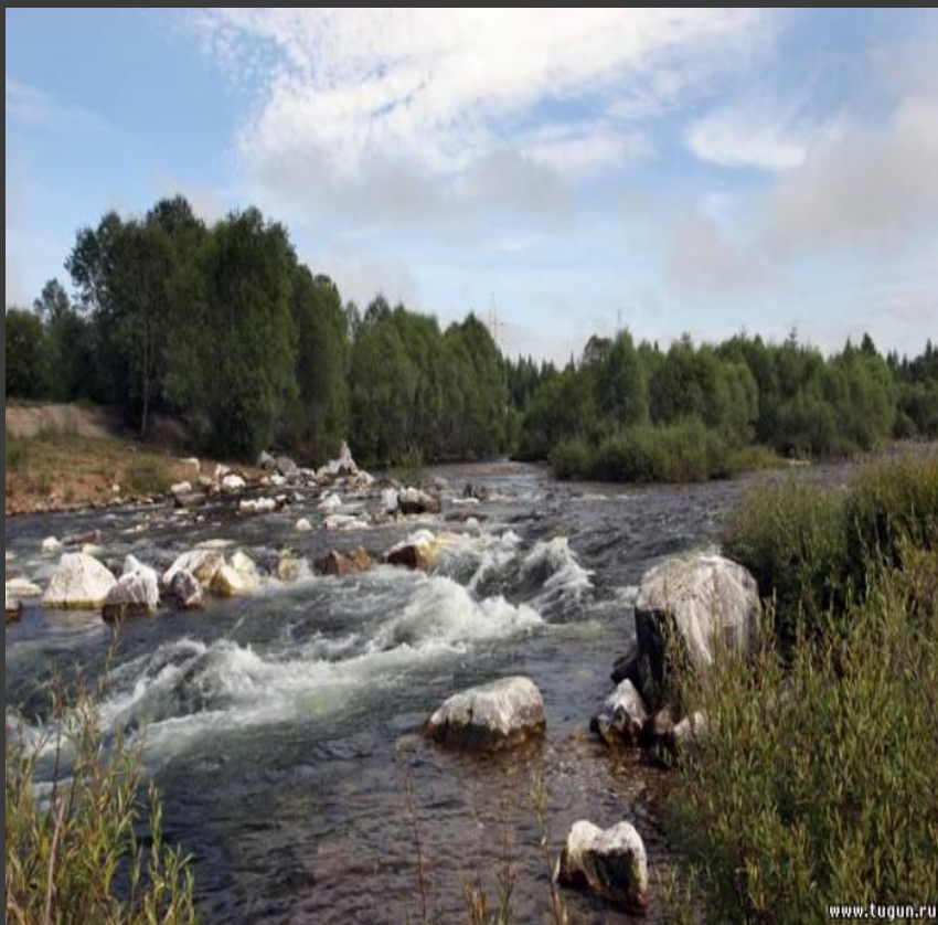
Чистая река Байкала