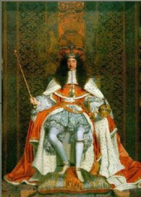
Карл II 1661 - 1685