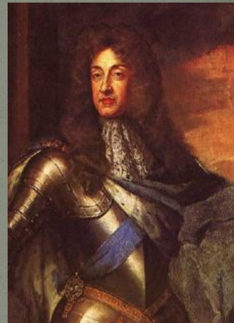
Яков II 1685 - 1688

Преследование пуритан Преследование революционеров Попытка восстановить католицизм