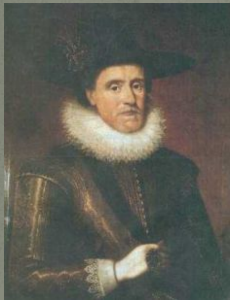
Яков I (1603 - 1625)