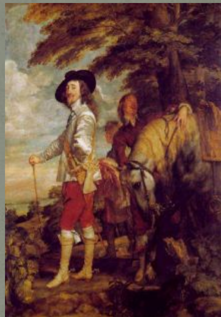
Карл I (1625 – 1649)

«Как мои предки могли допустить подобное учреждение?»