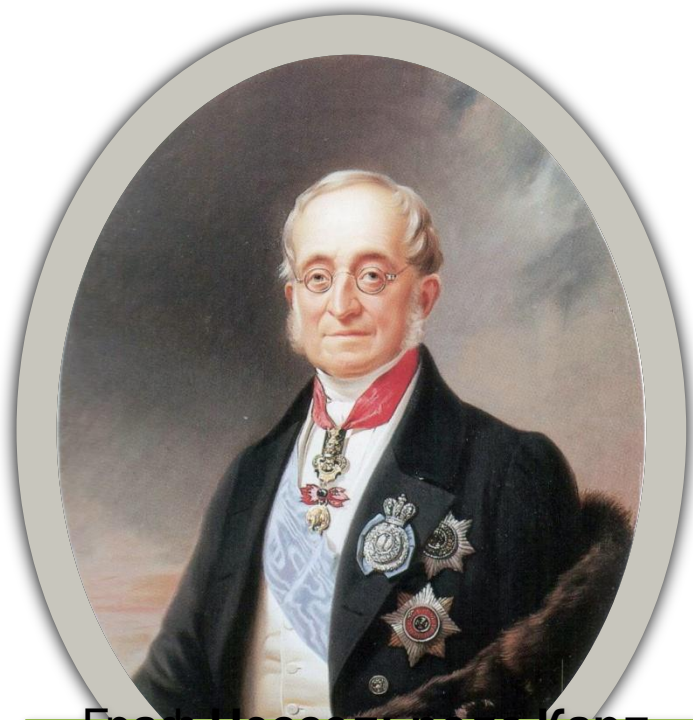
Граф Нессельроде Карл Васильевич (1780-1862), канцлер, Министр Иностранных дел (1816-1856).