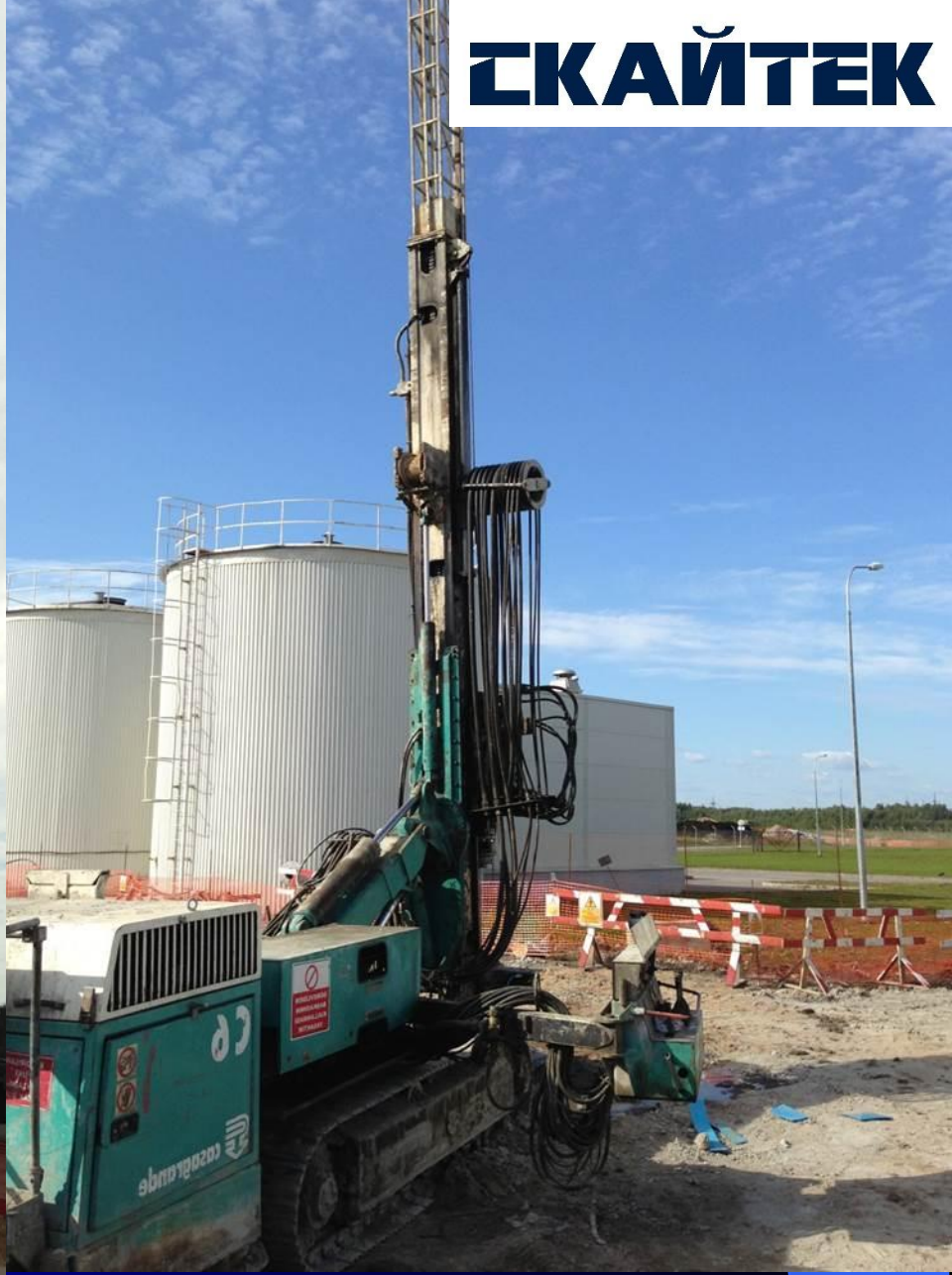
Россия, Санкт-Петербург, проект «Расширение завода Тойота» Заказчик: RENAISSANCE CONSTRUCTION