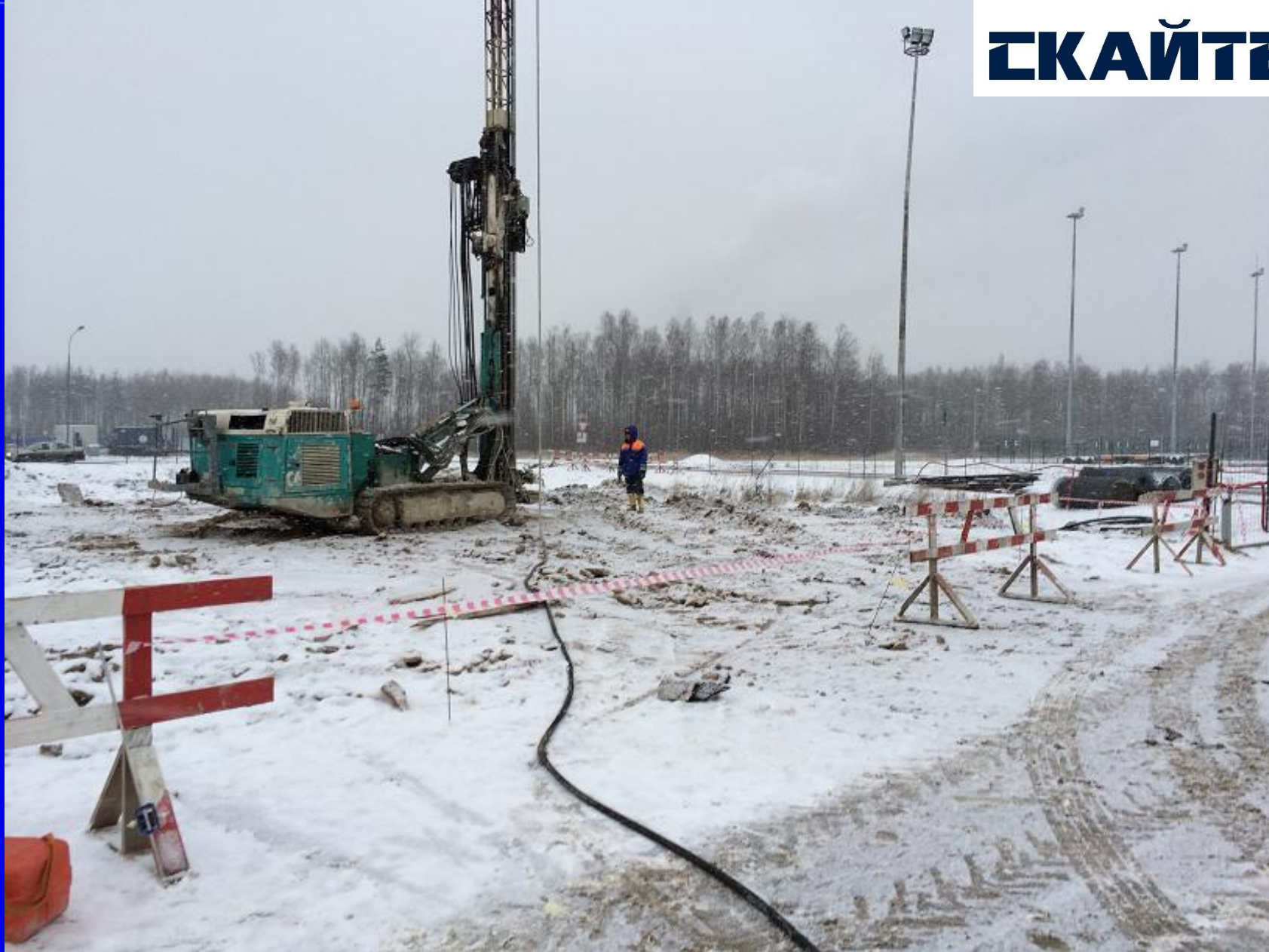
Россия, Санкт-Петербург, проект «ЗАВОД АВТОМОБИЛЕЙ GM» Заказчик: RENAISSANCE CONSTRUCTION