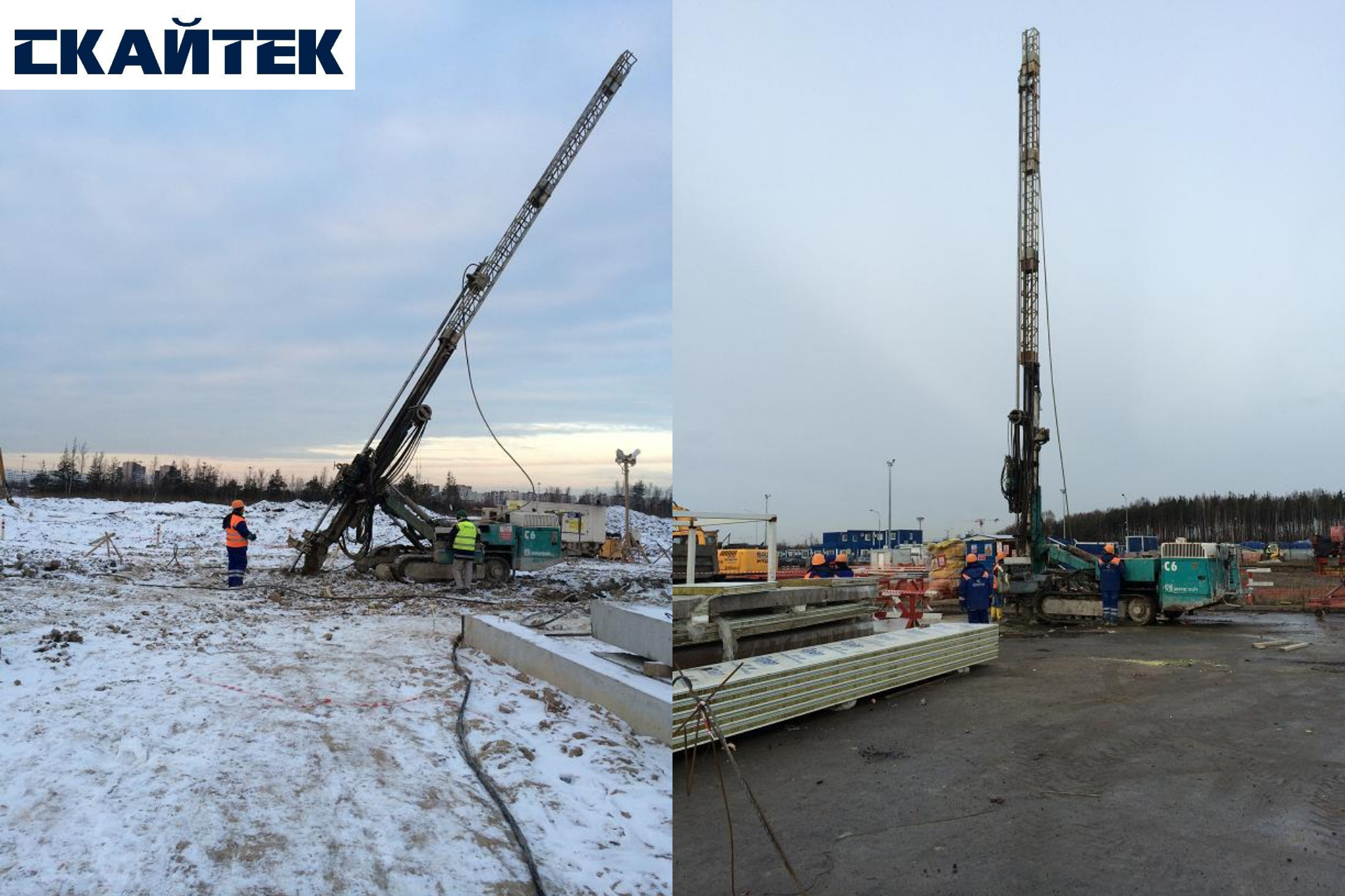
Россия, Санкт-Петербург, проект «ЗАВОД АВТОМОБИЛЕЙ GM» Заказчик: RENAISSANCE CONSTRUCTION