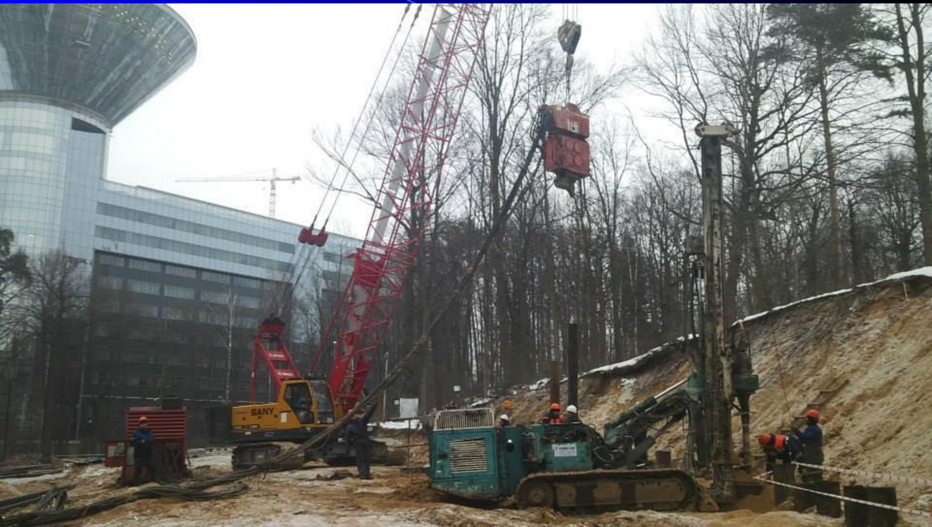
Россия, Москва, проект «РУБЛЕВО Жилой комплекс» Заказчик: АНТ ЯПЫ