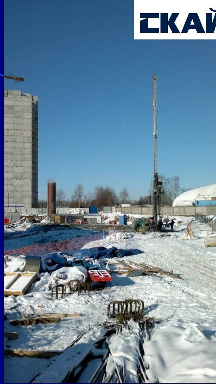
Россия, Москва, проект «ТЦ Реутов» Заказчик: RENAISSANCE CONSTRUCTION