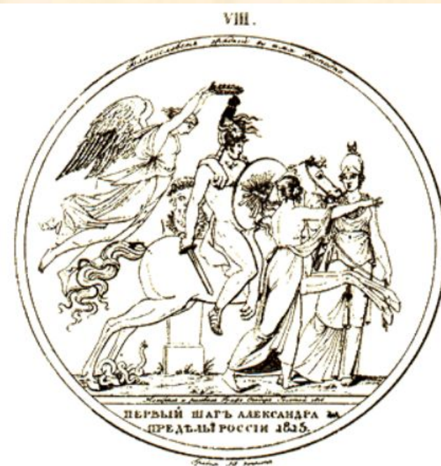
Толстой Федор Петрович Медаль «Первый шаг Александра за пределы России»

Уткин Николай Иванович ПЕРВЫЙ ШАГ АЛЕКСАНДРА ЗА ПРЕДЕЛЫ РОССИИ 1816