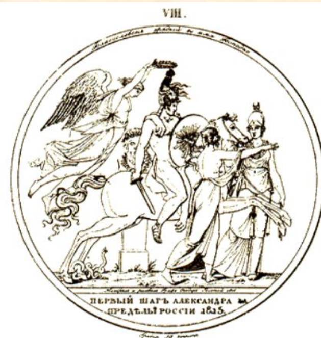
Толстой Федор Петрович Медаль «Первый шаг Александра за пределы России»

Уткин Николай Иванович ПЕРВЫЙ ШАГ АЛЕКСАНДРА ЗА ПРЕДЕЛЫ РОССИИ 1816