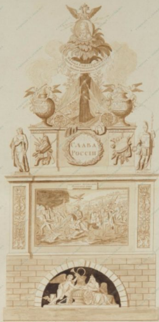
НОВОСЕЛОВ КОРНИЛИЙ ПРОЕКТ ПАМЯТНИКА М.И. КУТУЗОВУ Середина 1810-х По собственному рисунку Лавис. 615x405; 575x365 мм.

Монархъ Императоръ Миротворецъ Слава въ Цѣлѣхъ Всѣмъ Россіи Слава Россіи Слава Россіи Въспомогательный проектъ М.И. Кутузову Средина 1810-х По собственному рисунку Лавис. 615x405; 575x365 мм. Съ Представленіемъ Императору Съ Представленіемъ Императору Съ Представленіемъ Императору