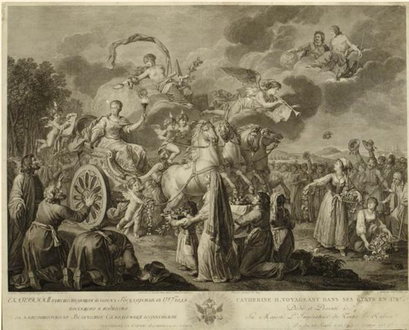
Жан-Жак Авриль Старший. 1744–1831. Франция Екатерина II, путешествующая в своем государстве в 1787 году. 1790. С рисунка Фердинанда де Мейса Бумага, гравюра резцом. Л. (обрезан) 57,1x70,6;