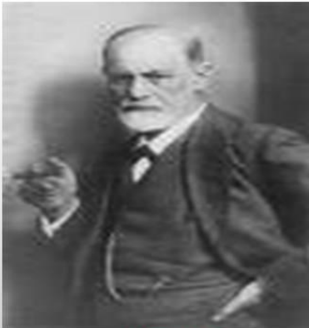
Афанасий Неофитович Шеншин