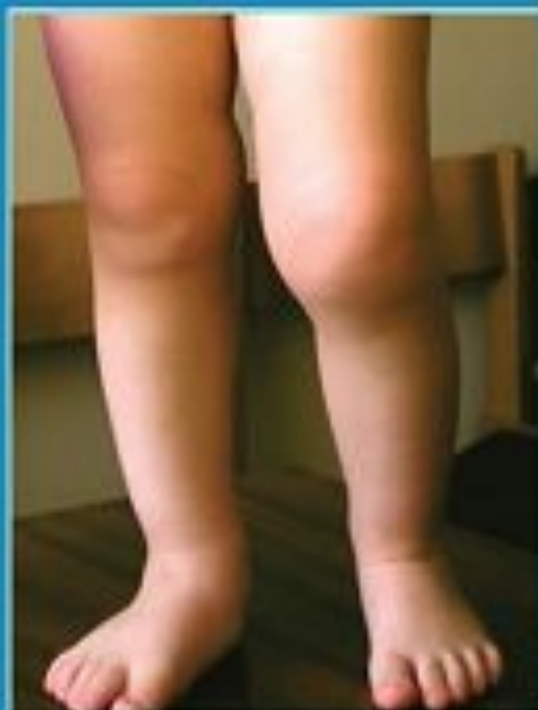
Рис. 4. Запалення лівого колінного суглоба у дитини з ревматоїдним артритом з системними проявами КРА.