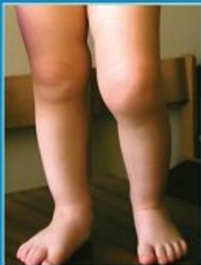
Рис. 4. Запалення лівого колінного суглоба у дитини з ревматоїдним артритом з системними проявами ЮРА.