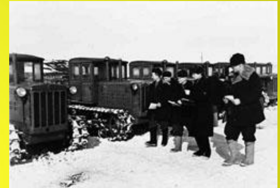
Члени комсомольсько-молодіжної тракторної бригади