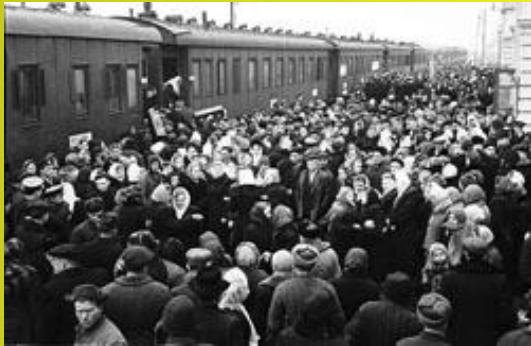
Проводи молоді Херсонщини на цілинні землі