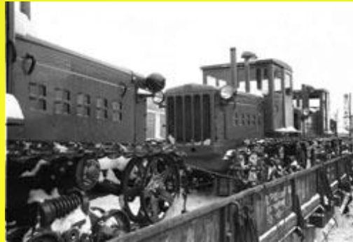
Трактори, випущені на ХТЗ для освоєння цілих земель