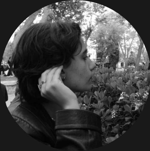
Quruluşçu rejissor Aytac Məcnun