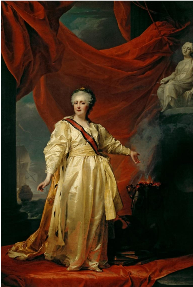
Левицкий Д. Г. Екатерина II – законодательница в храме богини Правосудия. 1783

«Просвещённый абсолютизм» – политика ряда абсолютистских государств Европы в сер. и 2-й пол. XVIII в., характеризующаяся следующими признаками: