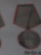
Орден Отечественной войны