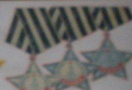
Орден Матери- героини