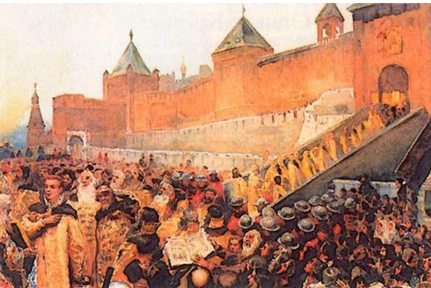
Вступление Дмитрия I в Москву. Картина К. Лебедева