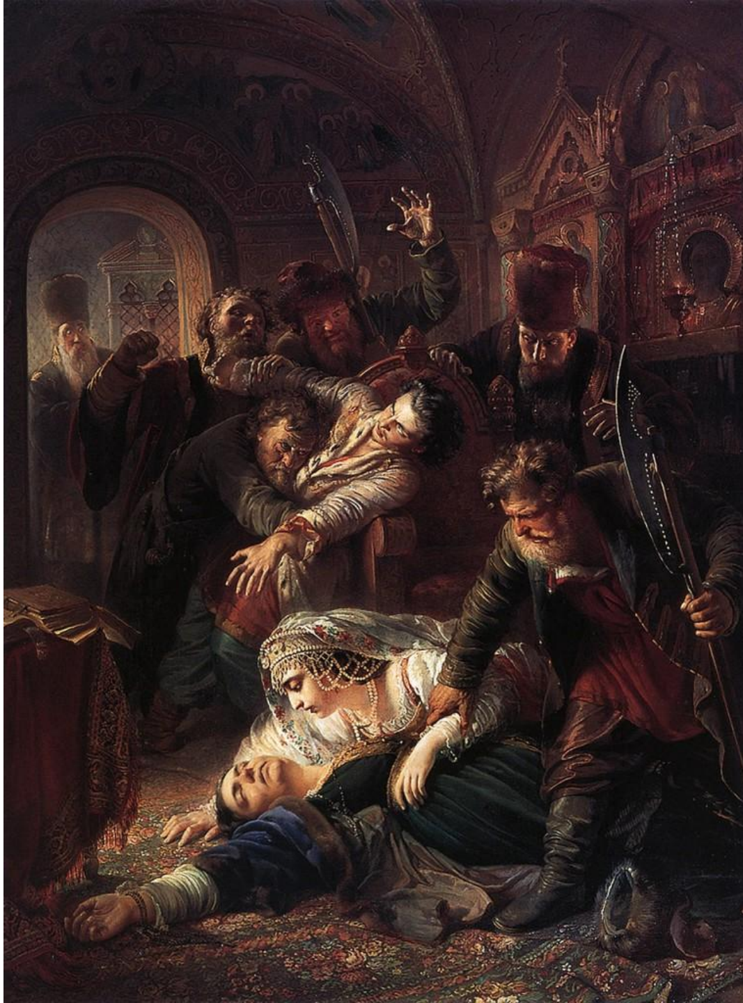
Константин Маковский. Агенты Дмитрия Самозванца убивают сына Бориса Годунова. 1862