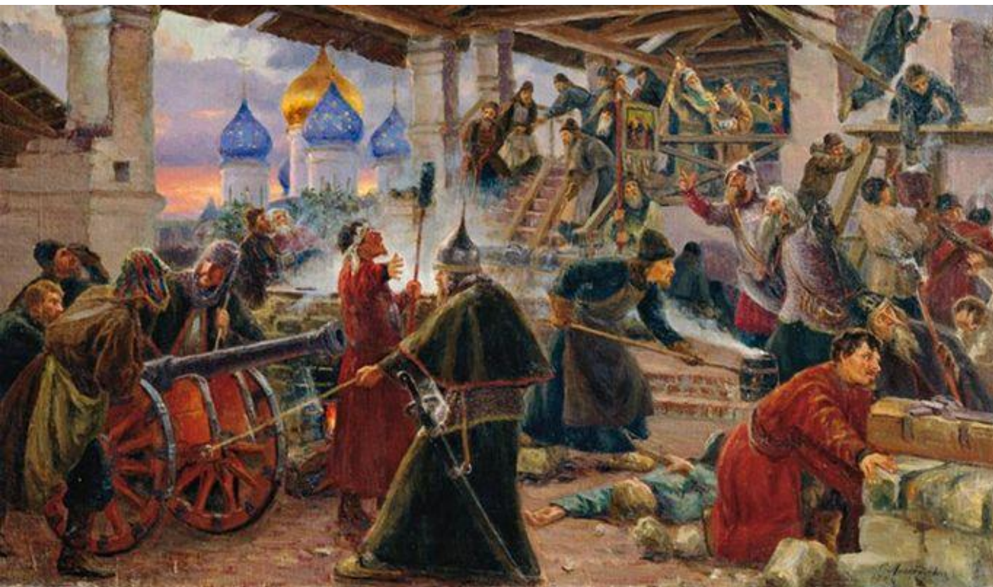
Сергей Милорадови ч. Оборона Троице- Сергиевой лавры. 1894