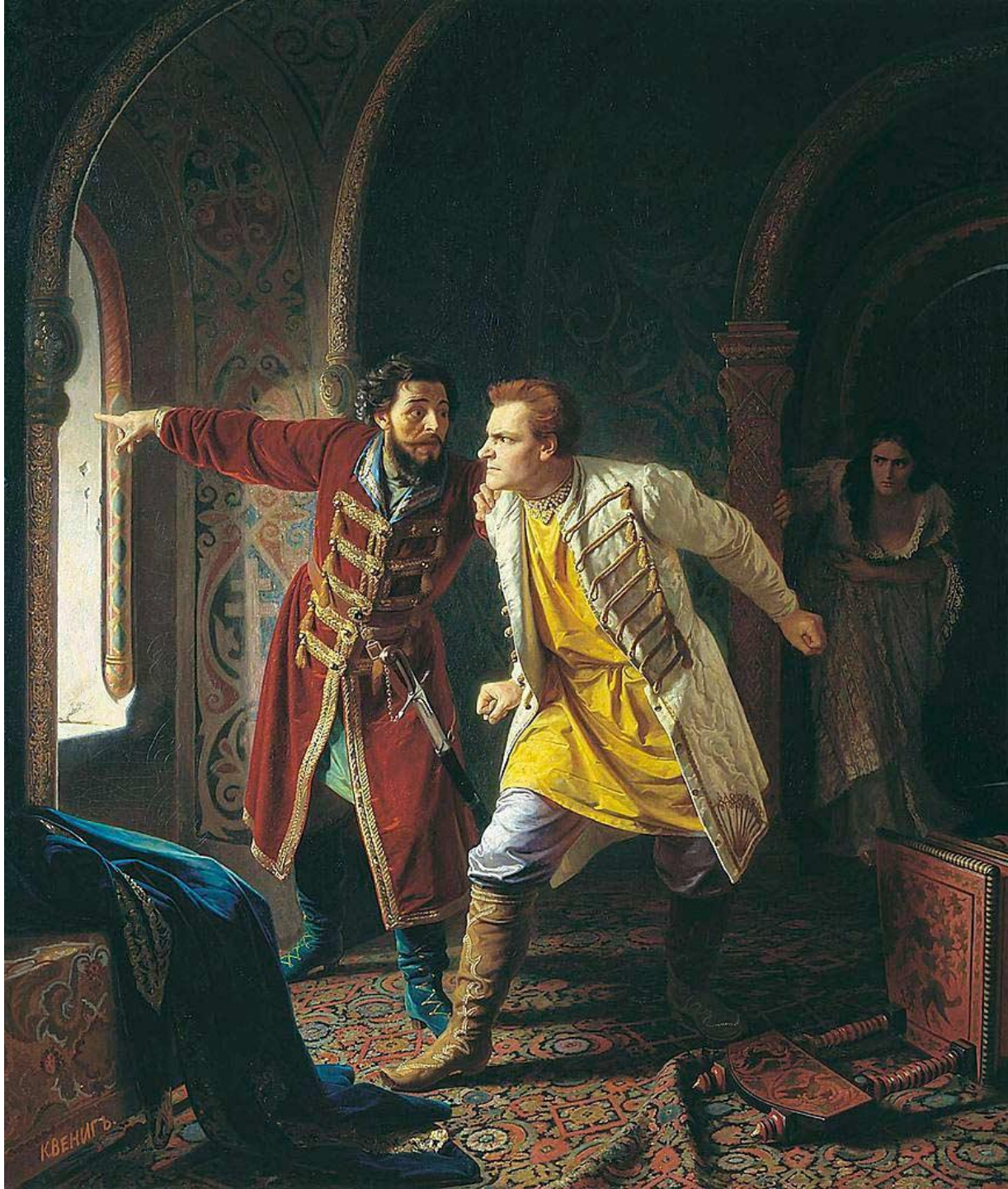
Последние минуты жизни Джедмитрия. Картина К. Венига, 1879