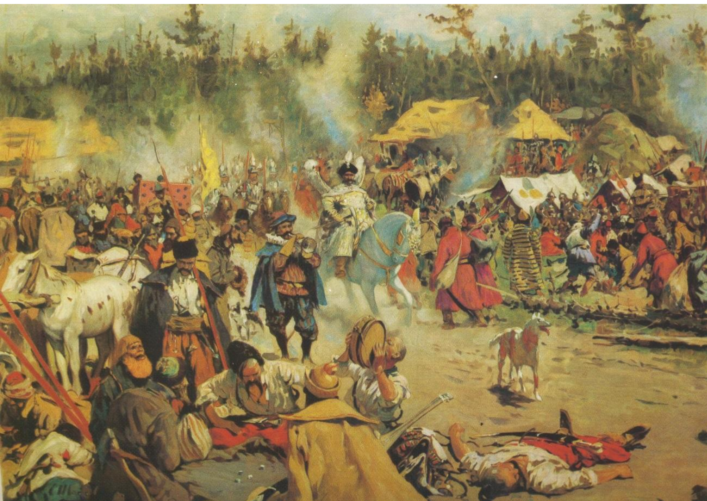
С. Иванов. Лагерь Лжедмитрия II в Тушино