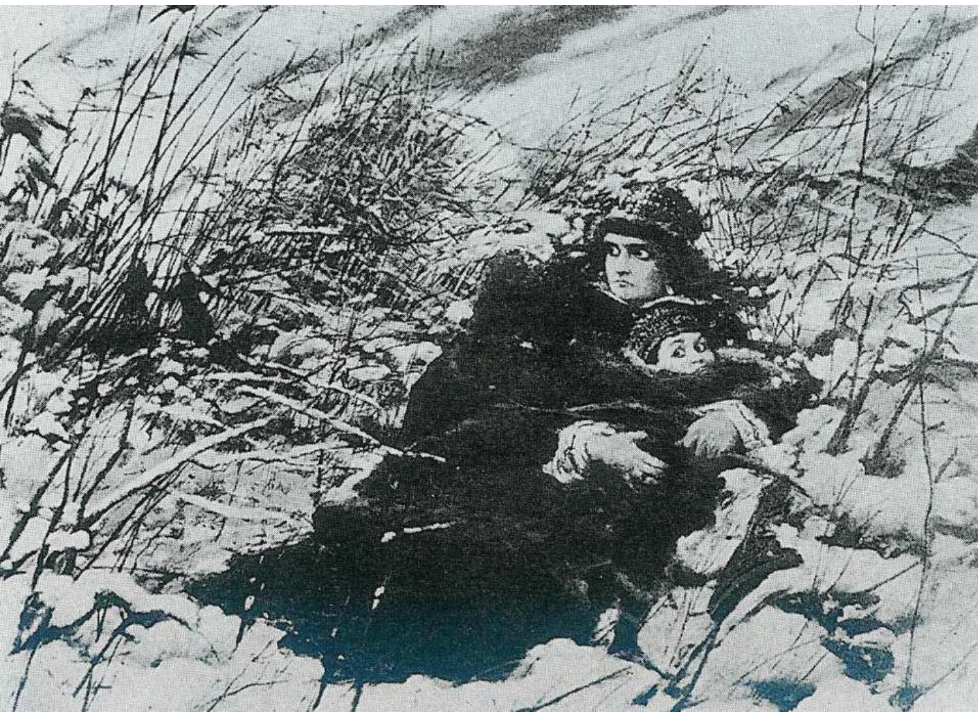
«Бегство Марины Мнишек», картина Леона Яна Вычулковского