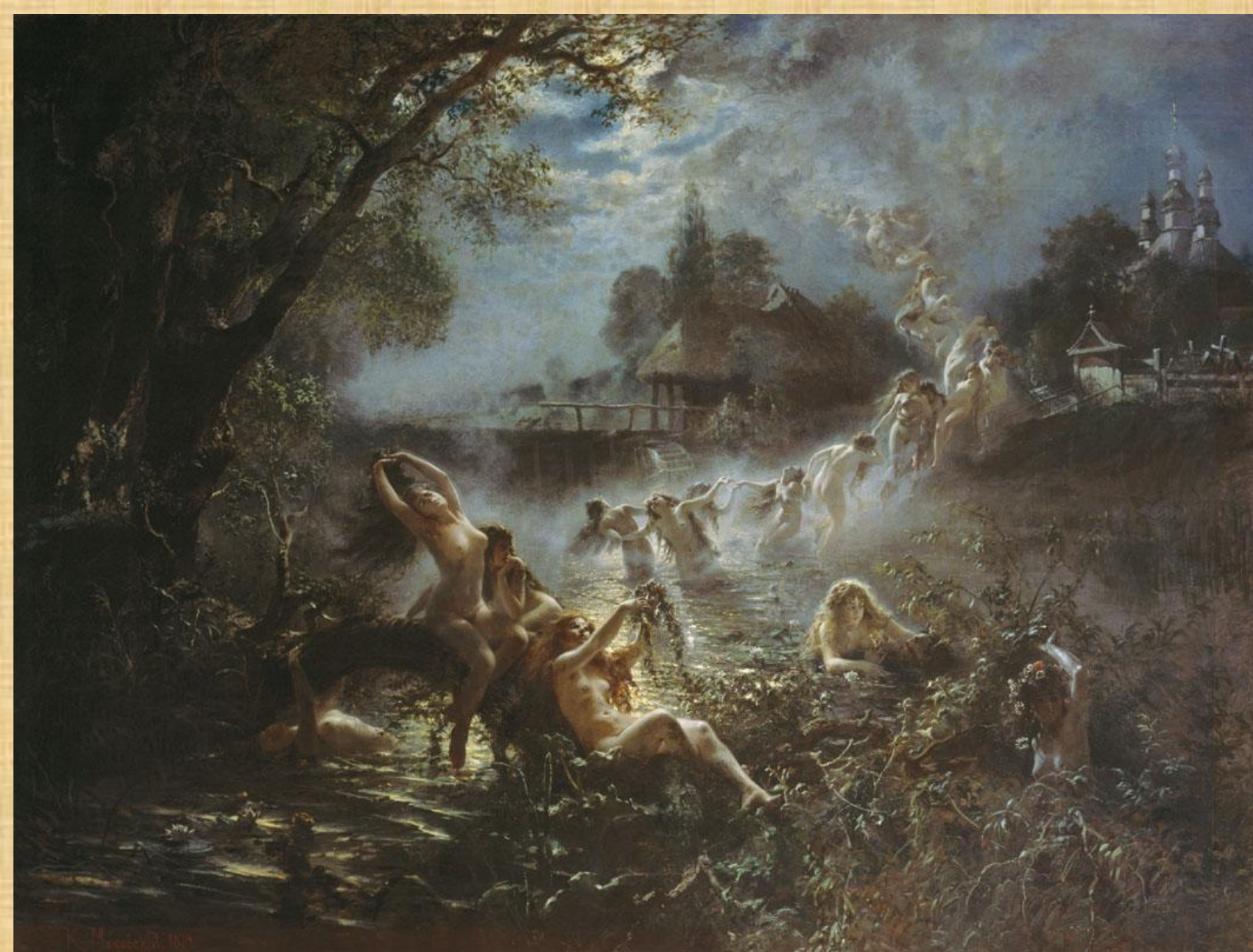
Константин МАКОВСКИЙ. Русалки (1879)