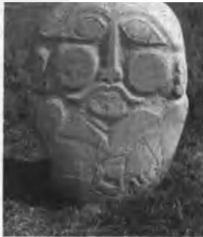
Голова кыргыза, высеченная из камня (каменный идол X–XII века).

Среди кыргызских памятников встречаются могилы выходцев из подвластных кыргызам народов, которые хоронили умерших не сжигая: например, кыштымов, а также отдельные кладбища уйгуров, захороненных вместе со шкурами коней, и древних тюрок, погребённых вместе с конями. Так, в археологических материалах отображается эпоха, когда кыргызы властвовали над различными племенами Сибири и Центральной Азии, во многом определяя дальнейшее развитие межэтнических культурных взаимоотношений тюркских народов.