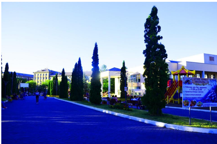
Фото 12. общий план

Парк появился недавно, поставили лавочки и детские комплексы, множество качелей для отдыха детям и взрослым