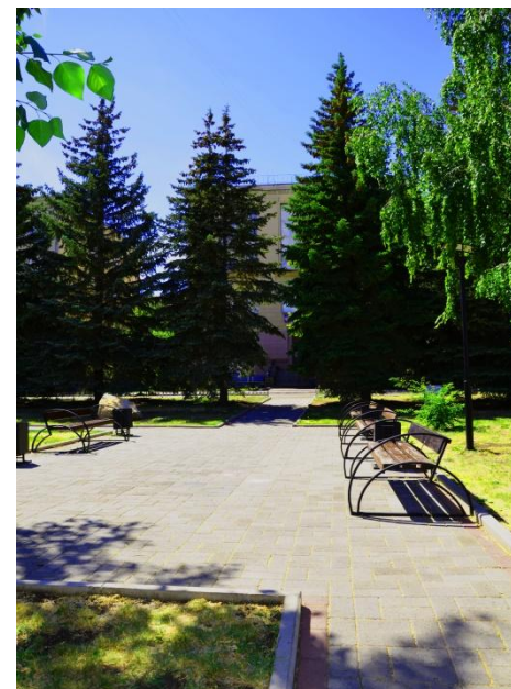
Фото 9. парк общим планом