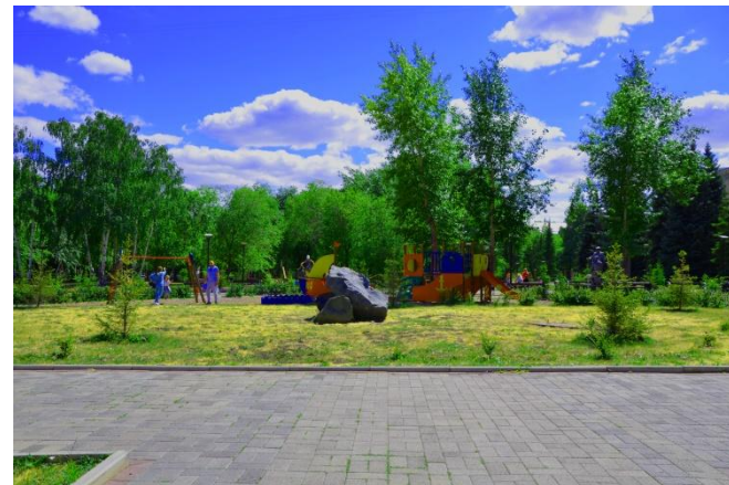
Фото 7. общий план. Камни в парке

В день торжественного открытия композиции и сквера, на территории заложили “Капсулу времени”, в которой хранится послание потомкам. Её вскроют только в далёком 2040 году, когда студенческому движению Магнитогорска исполнится 75 лет.