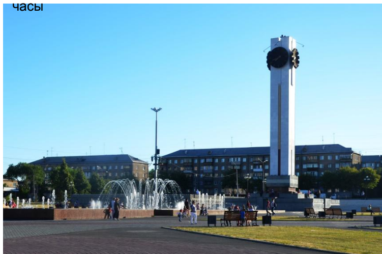
Фото 4. средний план. Фонтан и часы

Но идея все-таки появилась, местный архитектор Пономарев решил, что ничто так хорошо не будет олицетворять солидный отрезок времени, прожитой городом, как часы. Так появились на свет магнитогорские куранты. Это четырехгранная башня высотой почти в 30 метров, облицованная белым мрамором и красным туфом, на вершине которой укреплены черные круги циферблатов, со временем стрелки и цифры покрыли сусальным золотом. Куранты громко оповещают окрестности о времени перезвоном и громким боем. В теплое время года на площади радуется глаз еще одно прекрасное творение архитекторов — свето-музыкальный фонтан — конечно, ночью композиция выглядит более впечатляюще, но днем она тоже хороша — струи воды то взмывают вверх, то падают вниз, то кружатся в пируэтах, рисуя фантастические узоры, кажется, что наблюдать за ними, не отрывая взора, можно бесконечно.