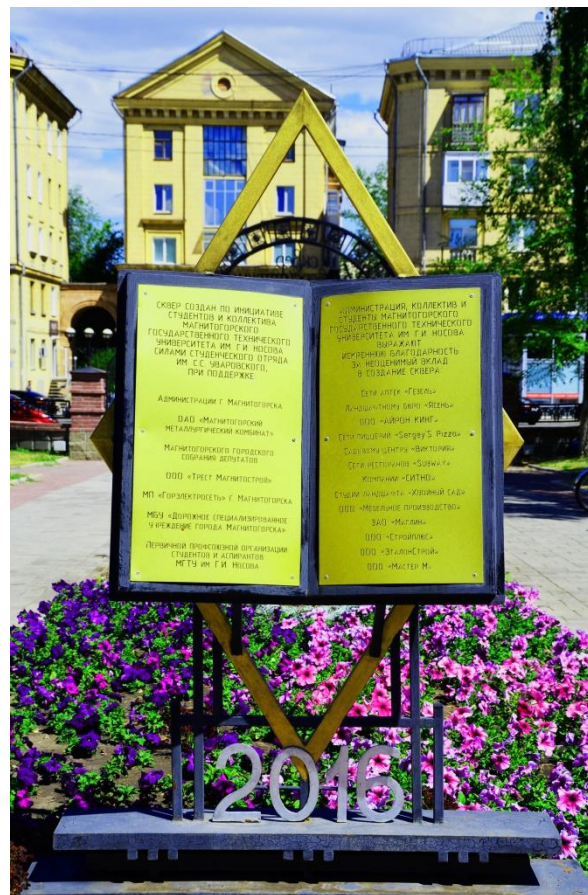
Фото 10. книжка крупным планом

В Студенческом сквере часто гуляют студенты после занятий, также здесь проводятся различные мероприятия, которые устраивают студенты.