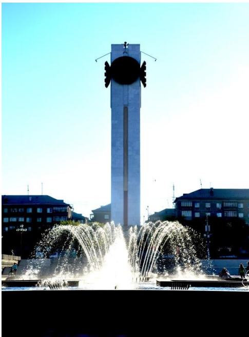
Фото 3. крупный план.