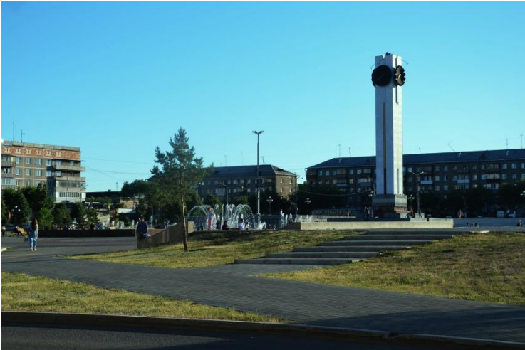
Фото 1. общий план