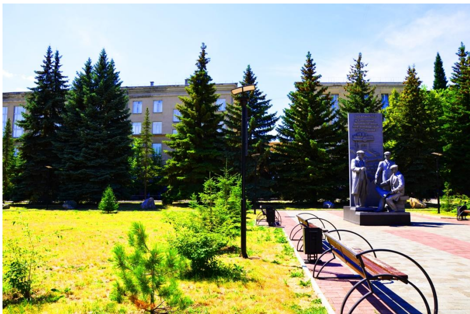
Фото 8. памятник общим планом