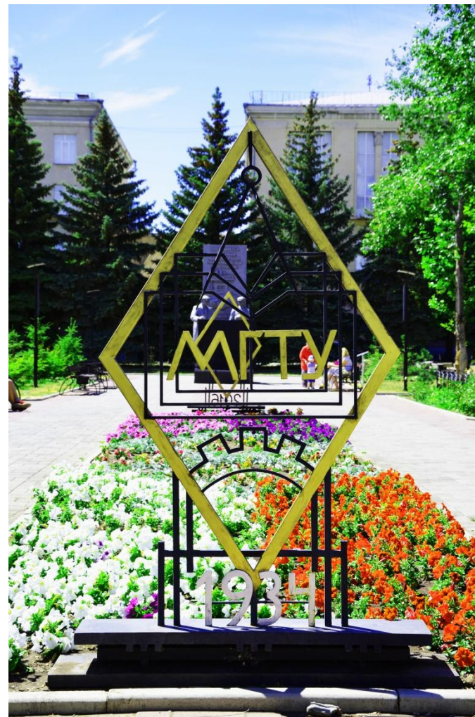
Фото 6. Крупный план. Памятный

В настоящее время сквер используется для проведения университетских праздников и различных конкурсов, как например конкурс снежных фигур. Рядом с МГТУ им. Г. И. Носова несколько лет назад открыли сквер, посвящённый студенческому строительному отряду Магнитогорска. Здесь же стоит памятный знак в честь всех студенческих отрядов города.