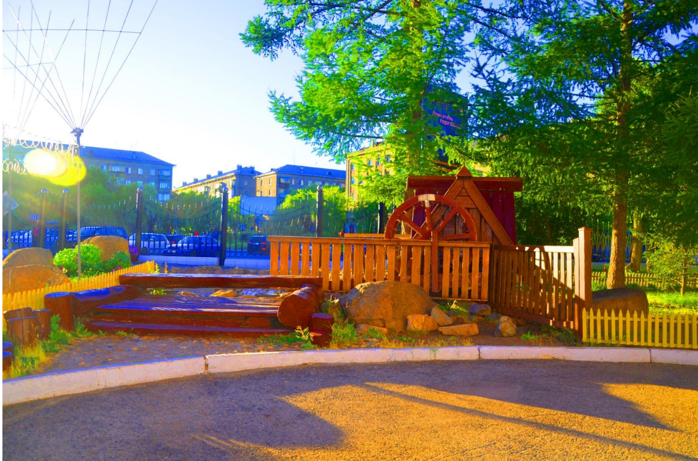
Фото 14. крупный план