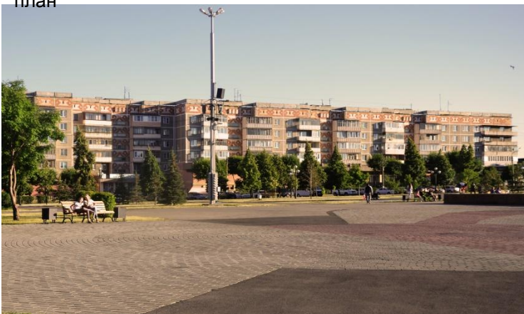
Фото 2. общий план. Парк

Площади народных гуляний, расположенной перед Белым домом — зданием городской администрации. Как уже понятно из названия, именно здесь горожане собираются в праздники, в новогодние дни устанавливается елка, и вырастает городок из чудных ледовых фигур. Главной достопримечательностью площади во все времена года являются магнитогорские куранты. История их появления достаточно интересна, началась она с задумки, возникшей в канун празднования 50-летия города — к круглой дате был построен Дом советов, установлен памятник «Тыл — фронту», но хотелось еще чего-то особенного, необычного, только вот чего именно, никто не знал, да к тому же поджимали сроки, — до праздничной даты оставалось всего несколько месяцев.