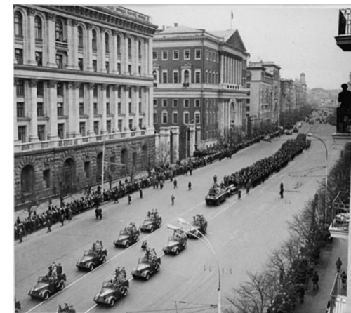
8 мая 1967 года. Кортёж с Вечным огнём движется по улице Горького (Тверской).