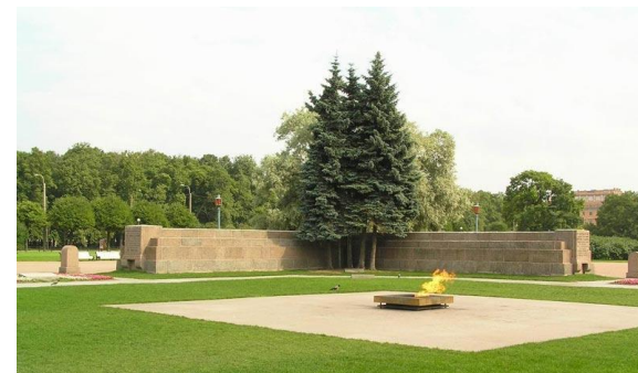
Вечный огонь на Марсовом поле в Ленинграде (Санкт-Петербурге)

На надгробной плите символическая скульптурная композиция: лавровая ветвь и солдатская каска на ниспадающем тяжелыми складками знамени. В центре мемориала — ниша с надписью: «Имя твое неизвестно, подвиг твой бессмертен». Автор этих строк — Сергей Михалков. Ниша сделана из лабрадорита с бронзовой пятиконечной звездой, в центре которой горит вечный огонь. Факел для могилы неизвестного солдата у кремлевской стены зажгли от вечного огня на Марсовом поле в Ленинграде. Факел доставили по эстафете, причем на всем пути ее следования стоял живой коридор — люди считали своим долгом отдать дань памяти всем погибшим в войне. Делегацию возглавлял легендарный летчик Великой Отечественной войны, Герой Советского Союза Алексей Маресьев.