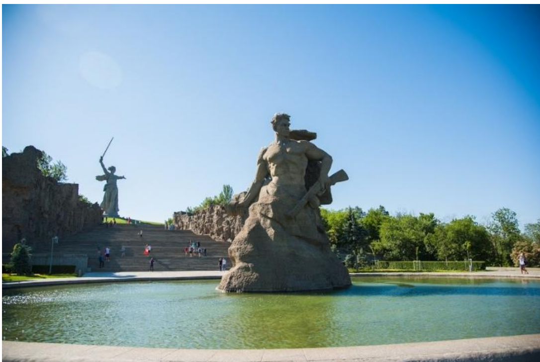
Памятник Неизвестному солдату в Волгограде

Он умер от семьи своей вдали, И гибели его нам неизвестна дата... К могиле неизвестного солдата Известные солдаты подошли... Мы этот образ до сих пор храним - Истерзанный свинцом лежал парнишка, И не было при нём военной книжки - Она в бою погибла вместе с ним. Пусть мы его фамилии не знаем, - Он был - мы знаем - верным до конца. И мы в молчанье головы склоняем Перед бессмертным подвигом бойца. И дружба воинов неколебимо свята, Она не умирает никогда! Мы по оружию родному брату Воздвигли памятник на долгие года! Соединим же верные сердца И скажем, как ни велика утрата, - Пусть нет фамилии у нашего бойца, - Есть звание российского солдата!