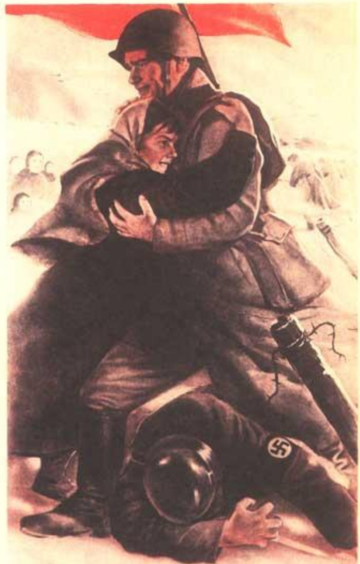
306. Кокорекин А. Воину-победителю — всенародная любовь! 1944