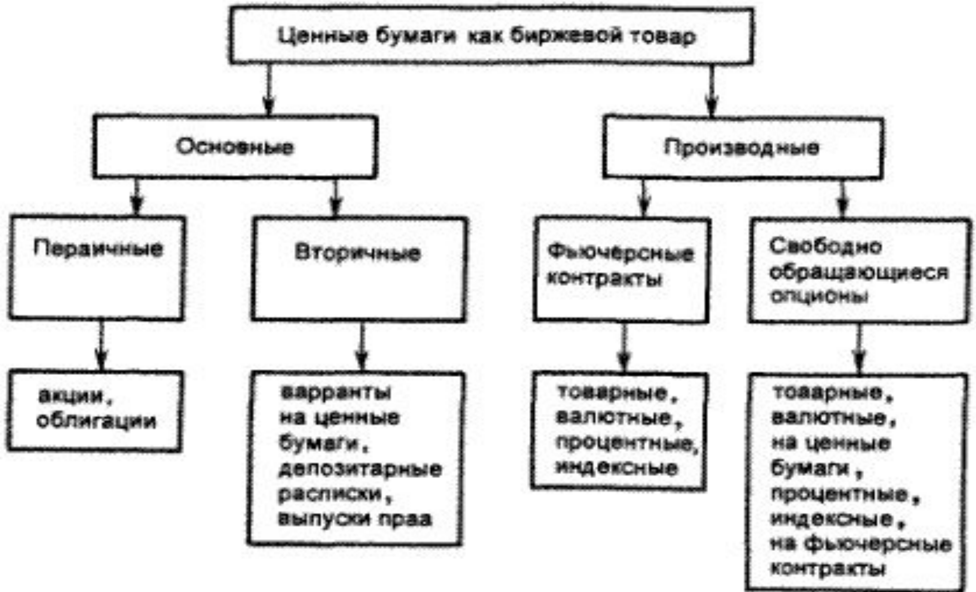
Рис. 3.2. Виды ценных бумаг, которыми торгуют на биржах