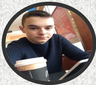
----- Основатель, Генеральный директор, Директор УК