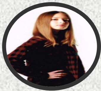
----- Директор Департамент а открытия, Департамент а создания продукта.