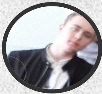
----- Директор Департамента Поддержки.