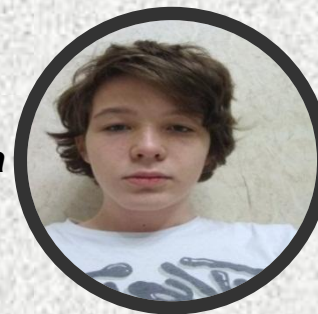
----- Директор Департамента развития