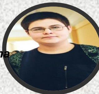
----- Директор УК, Директор Департамент а создания продукта.