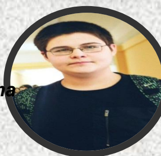
----- Директор УК, Директор Департамент а создания продукта.