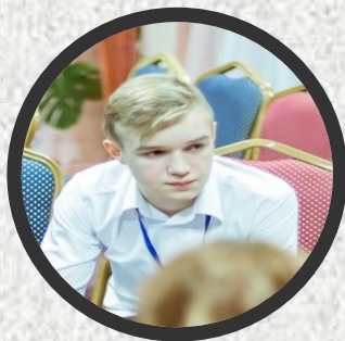
----- Директор департамента маркетинга