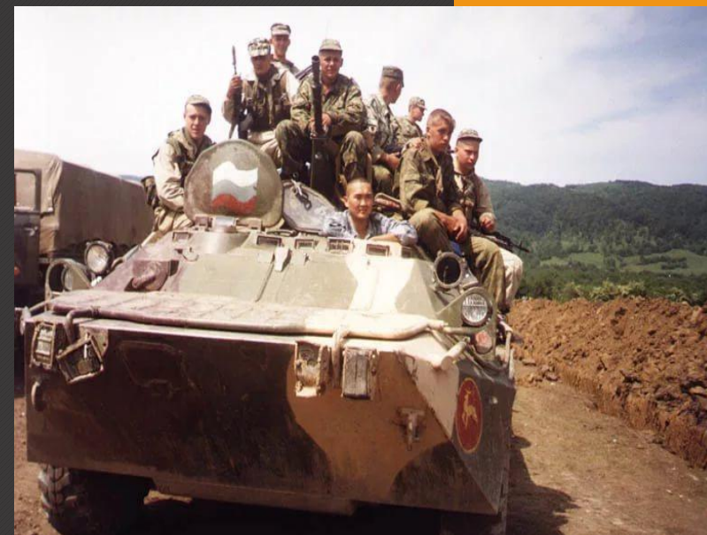
БТР в патруле.