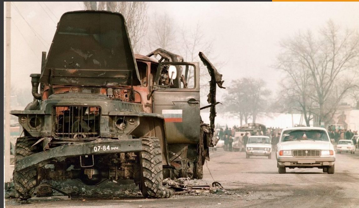
Подбитый боевиками Российский транспорт.