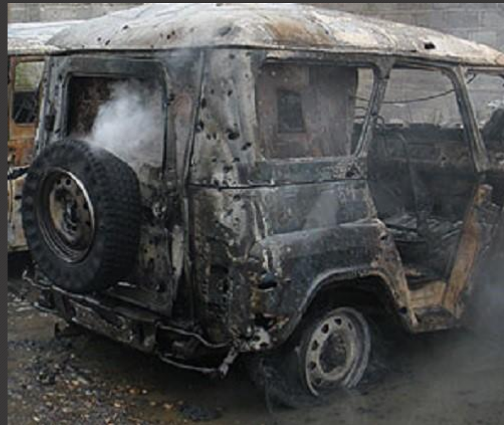
Машина после атаки боевиков в Чечне.