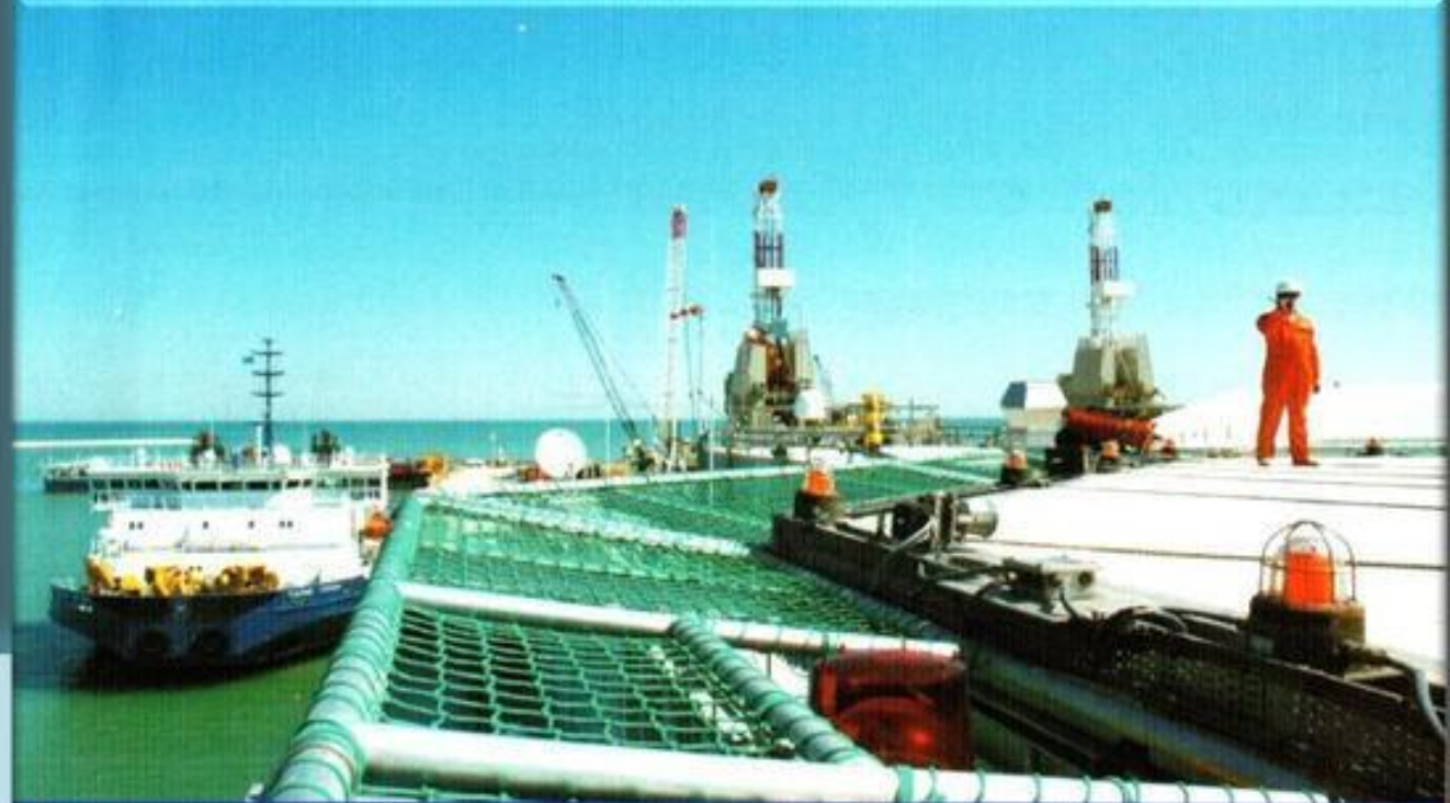
Қашаған, «Д» аралы