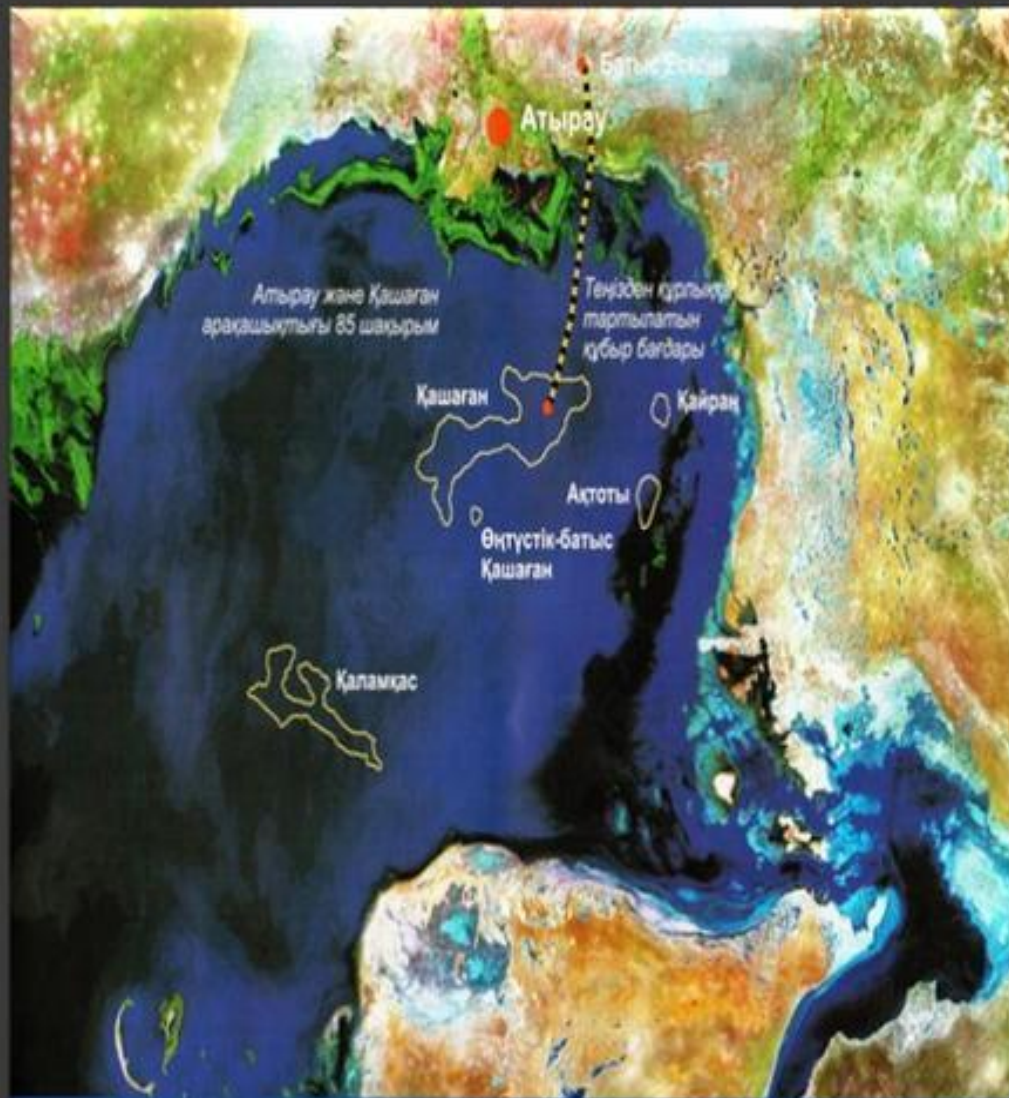
Солтүстік Каспий бойына ӨБХ шекарасындағы өндіріс тереңдігі Қашаған кенорны және басқа кендерінің арқылы өткізілетін түсірілетін суреті

Қашаған – Атыраудың оңтүстік-батысында 80 шақырым жерде орналасқан, Қазақстан бөлшегінде алғашқы игеріліп жатқан ең ірі кенорын. Оның ауданы шамамен 75 x 45 километрге тең. Өндірілетін мұнай қоры 1,5-10,5 млрд тонна аралығында болса, ал жалпы геологиялық мұнай қоры – 6,4 млрд т. және газ 1 трлн м 3 құрайды. Мұнай қабатының тереңдігі теңіз түбінен 4000-4500 метр тереңдікте жатыр. Бастапқы қойнауқаттық қысым өте жоғары – 800 бар. Күкіртті газдың мөлшеріде өте жоғары болады.