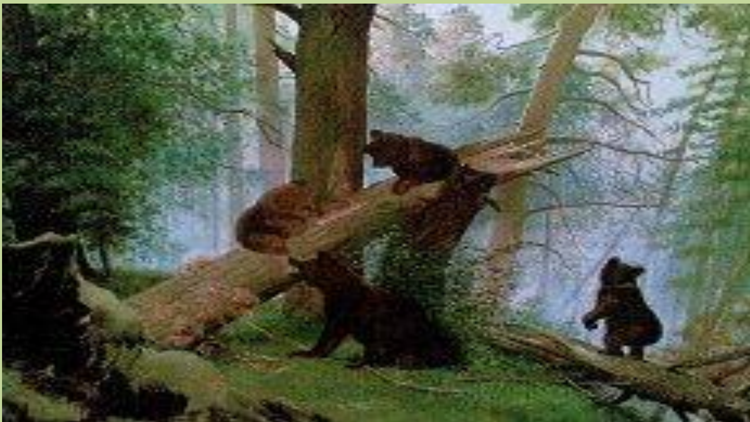
Или "Утро в сосновом бору" Шишкина