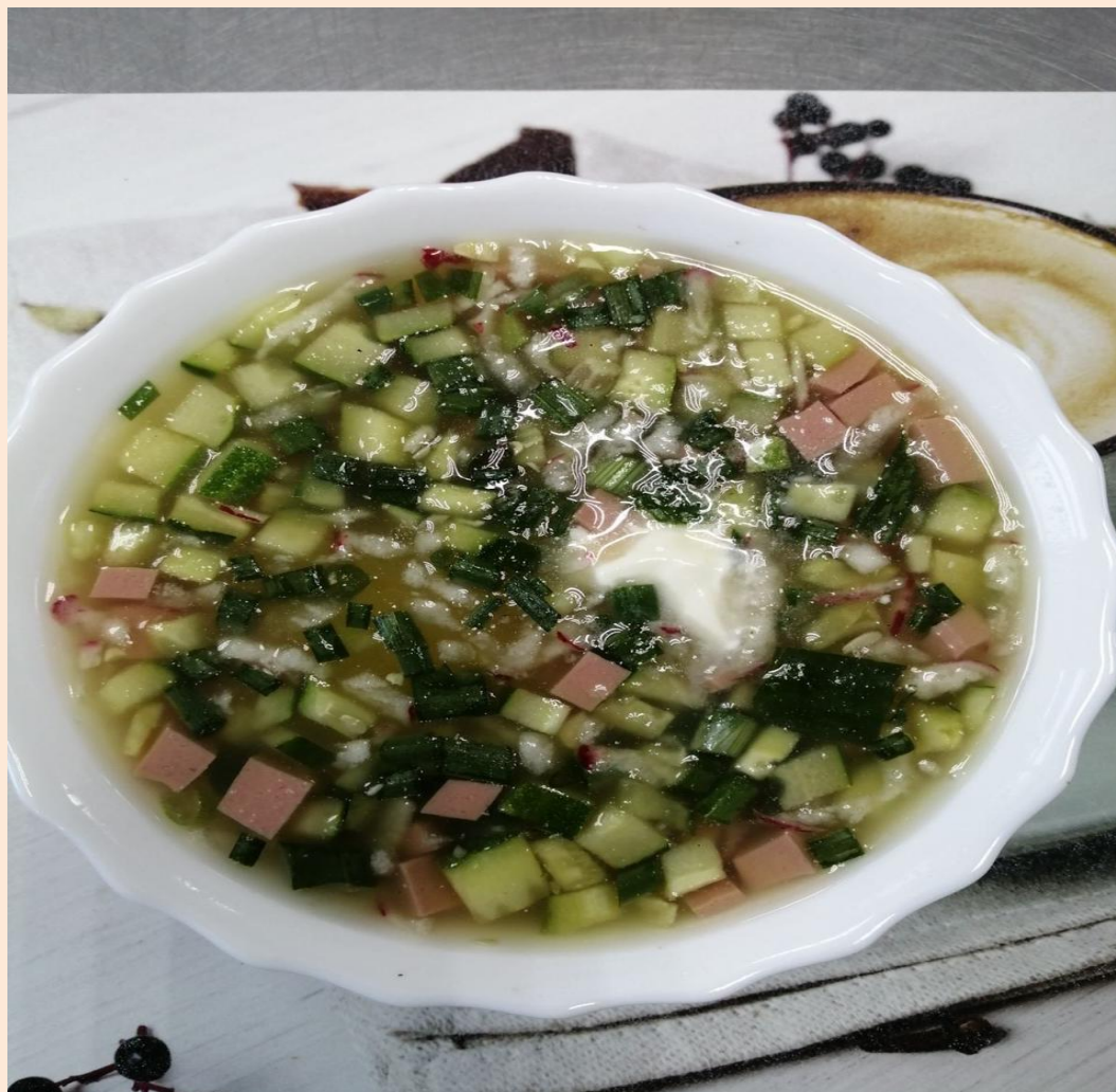
Окрошка с колбасой или мясом (на выбор)