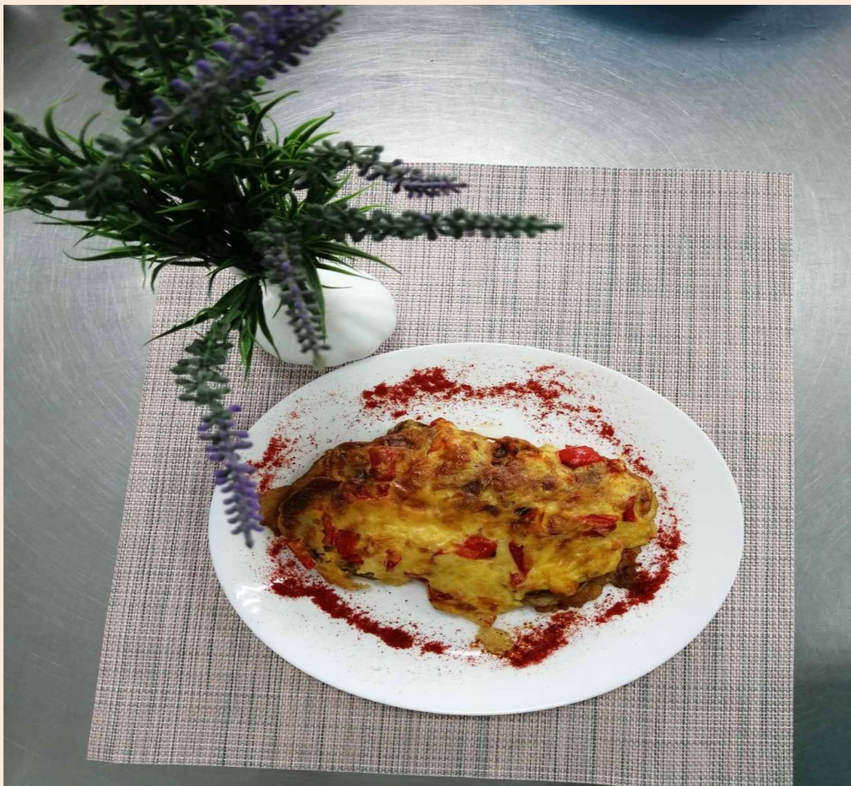
Мясо под шубой (курица/свинина)