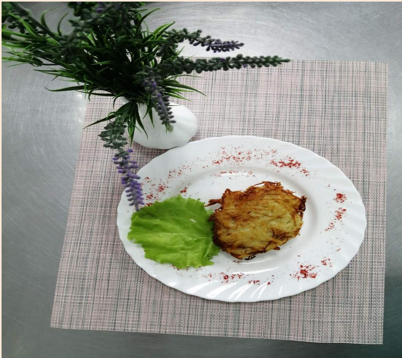
Горбуша/курица в картофельной корочке