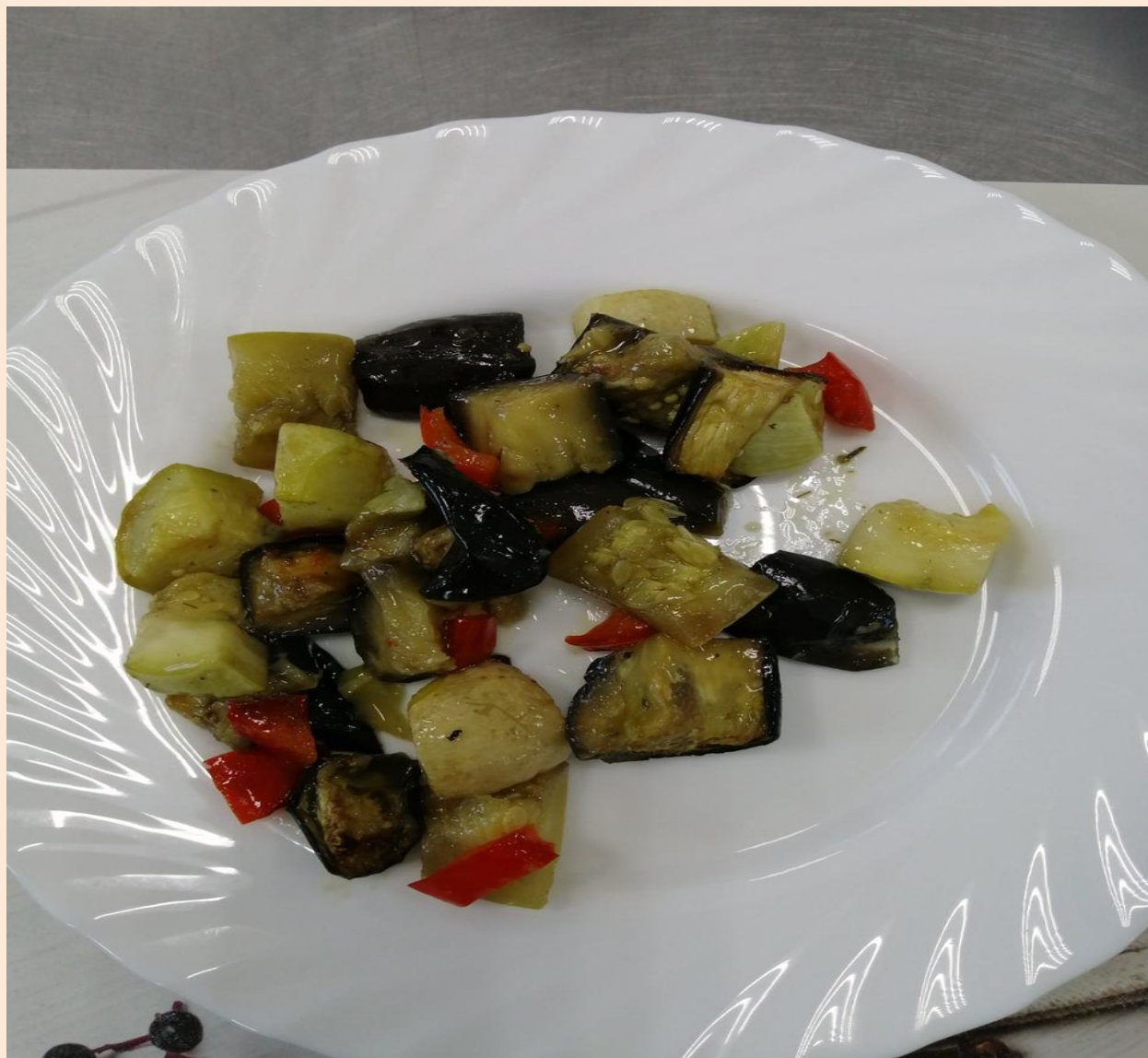
Овоци на пару