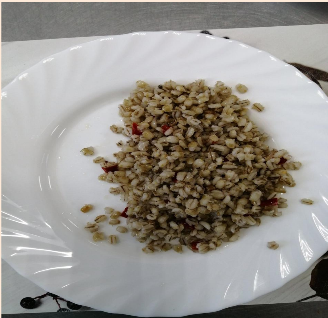
Каша перловая с овощами