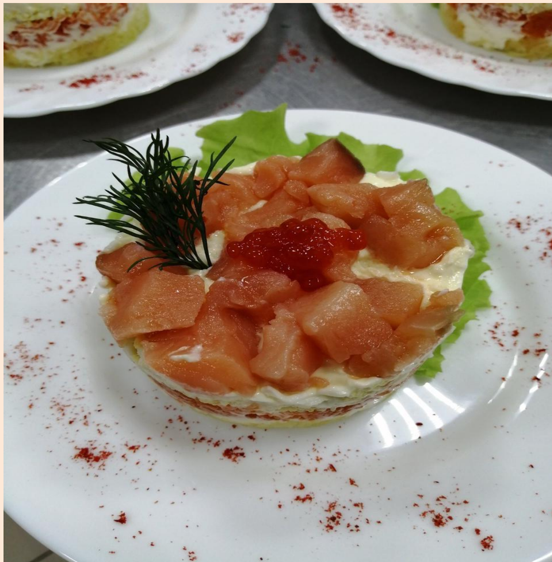
Салат «Царский» с сёмгой