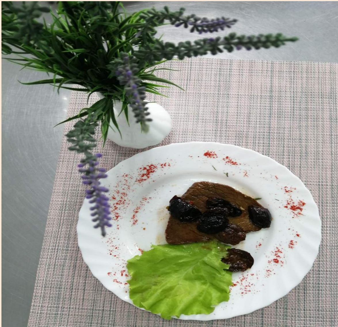
Говядина с черносливом в кисло-сладком соусе