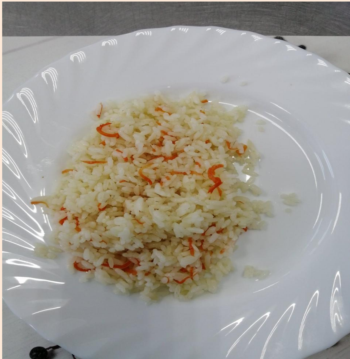
Рис с овощами