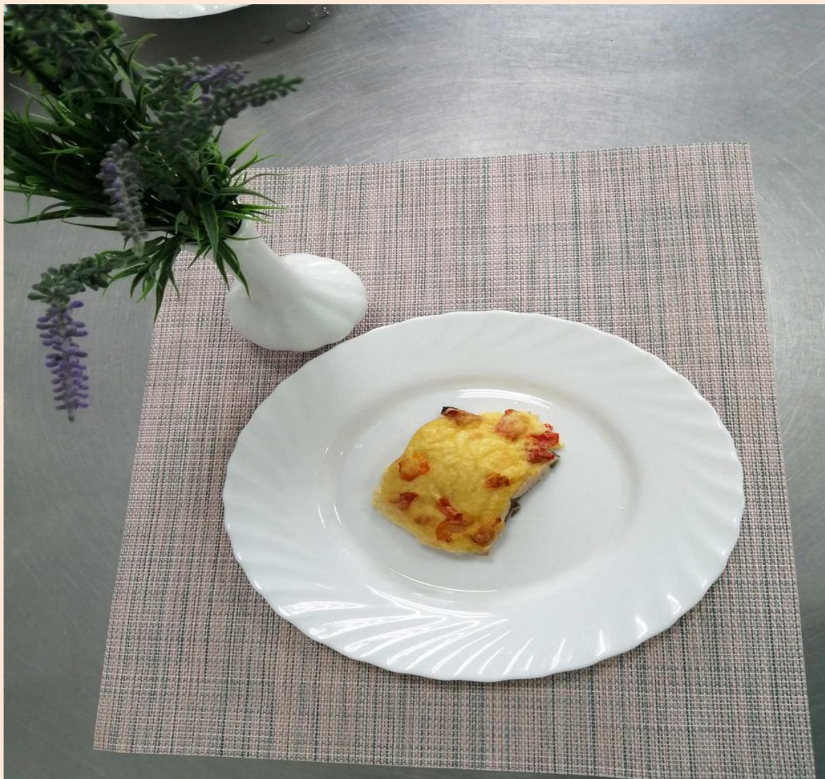
Горбуша запеченная с овощами