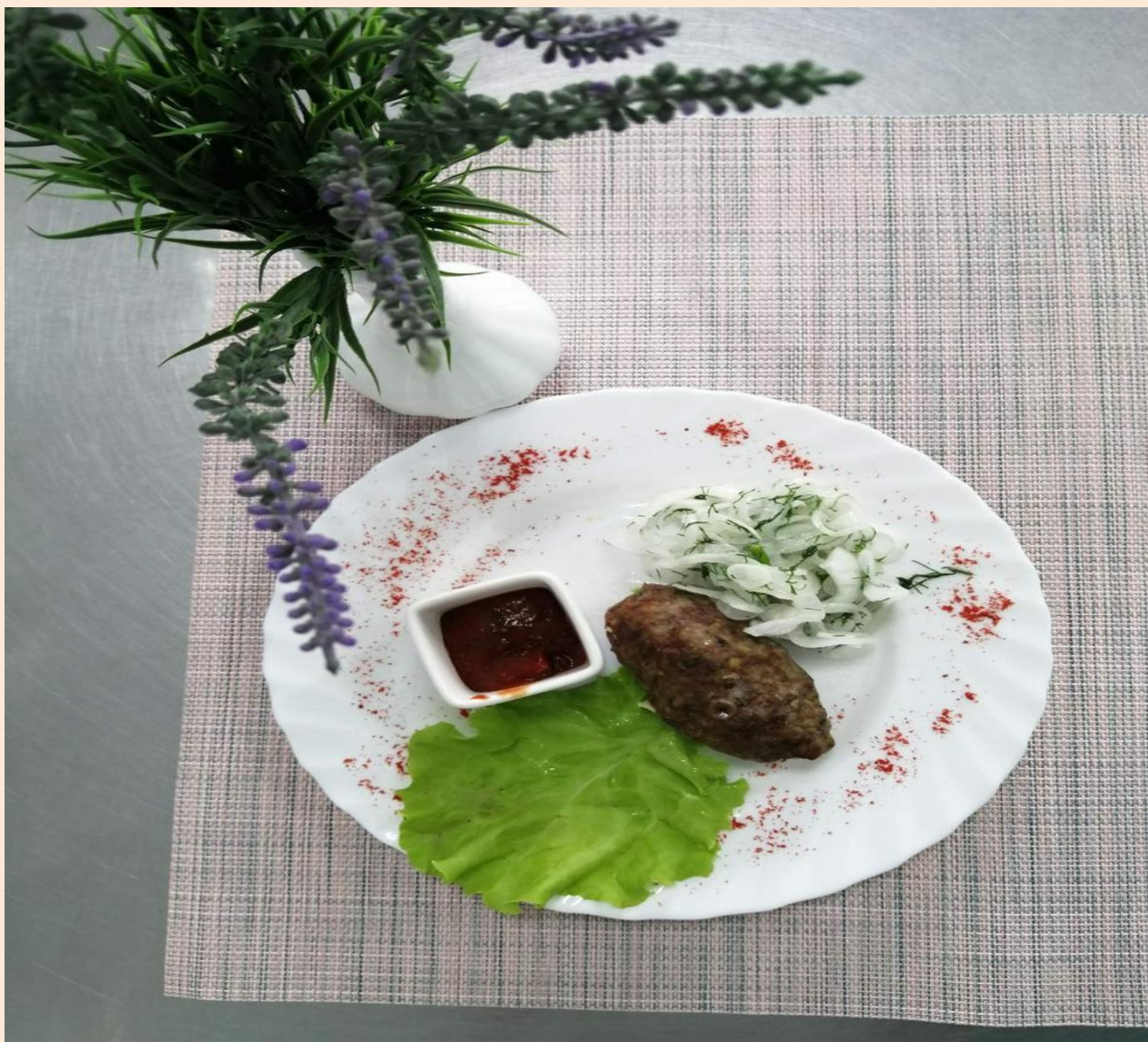
Люля кебаб из говядины/курицы