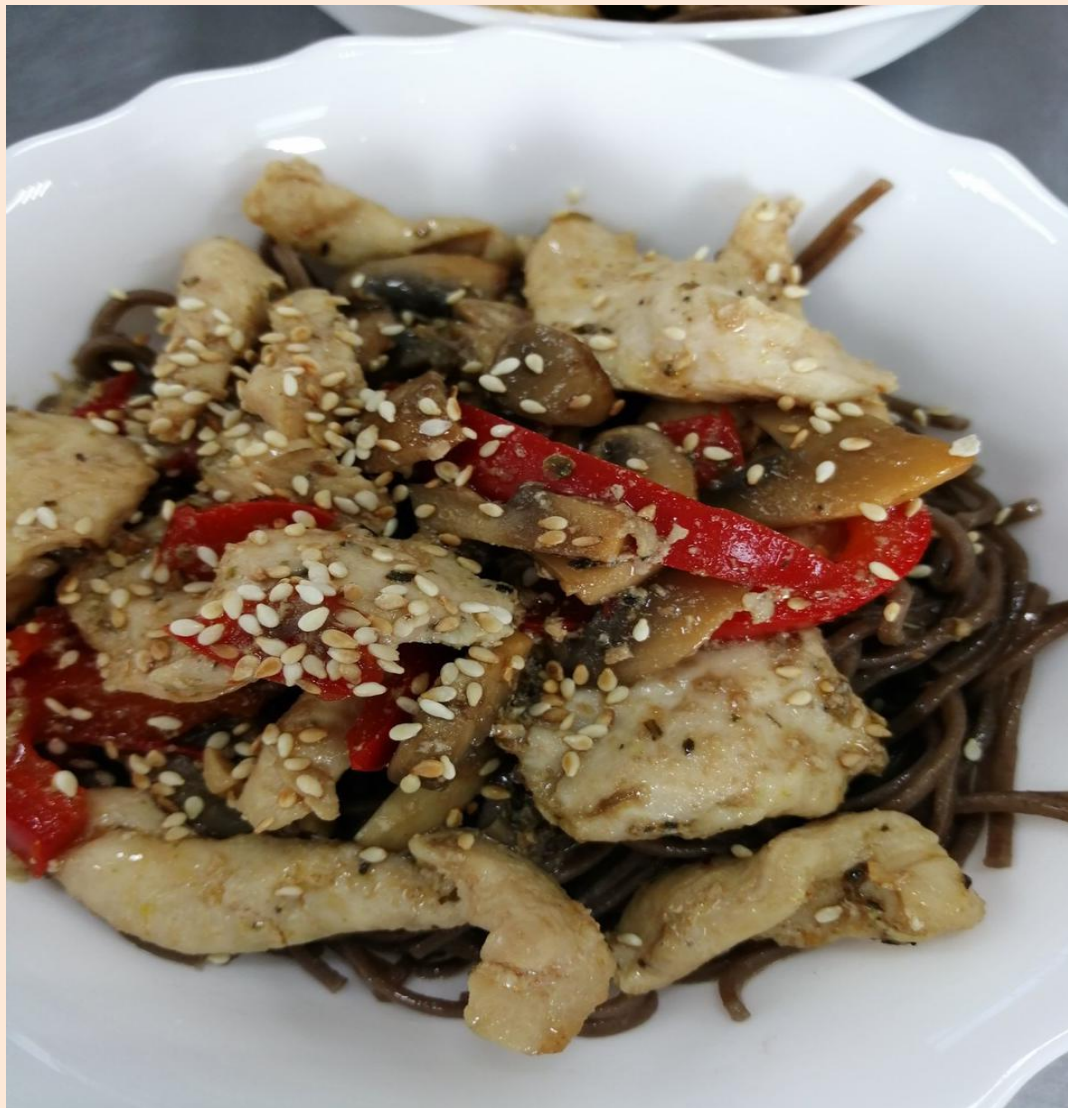
Гречневая лапша с курицей