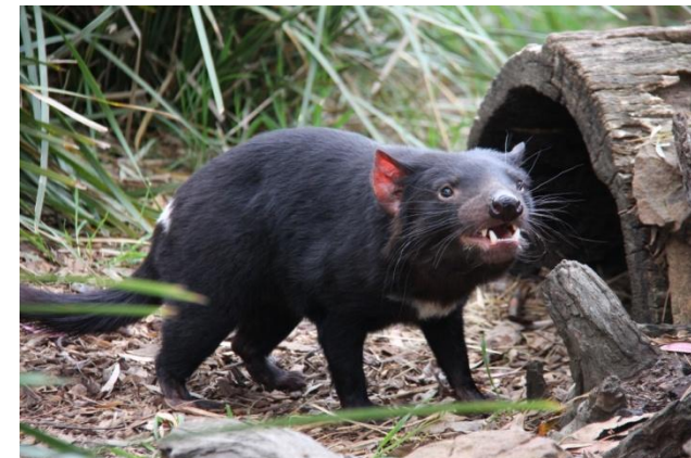
Тасманийский сумчатый дьявол

Детёныши этих животных появляются на свет почти полностью недоразвитыми, а затем растут в сумке у матери