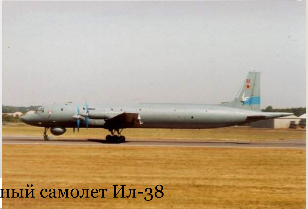
Противолодочный самолет Ил-38

Она состоит из: стратегической; тактической; палубной; береговой.