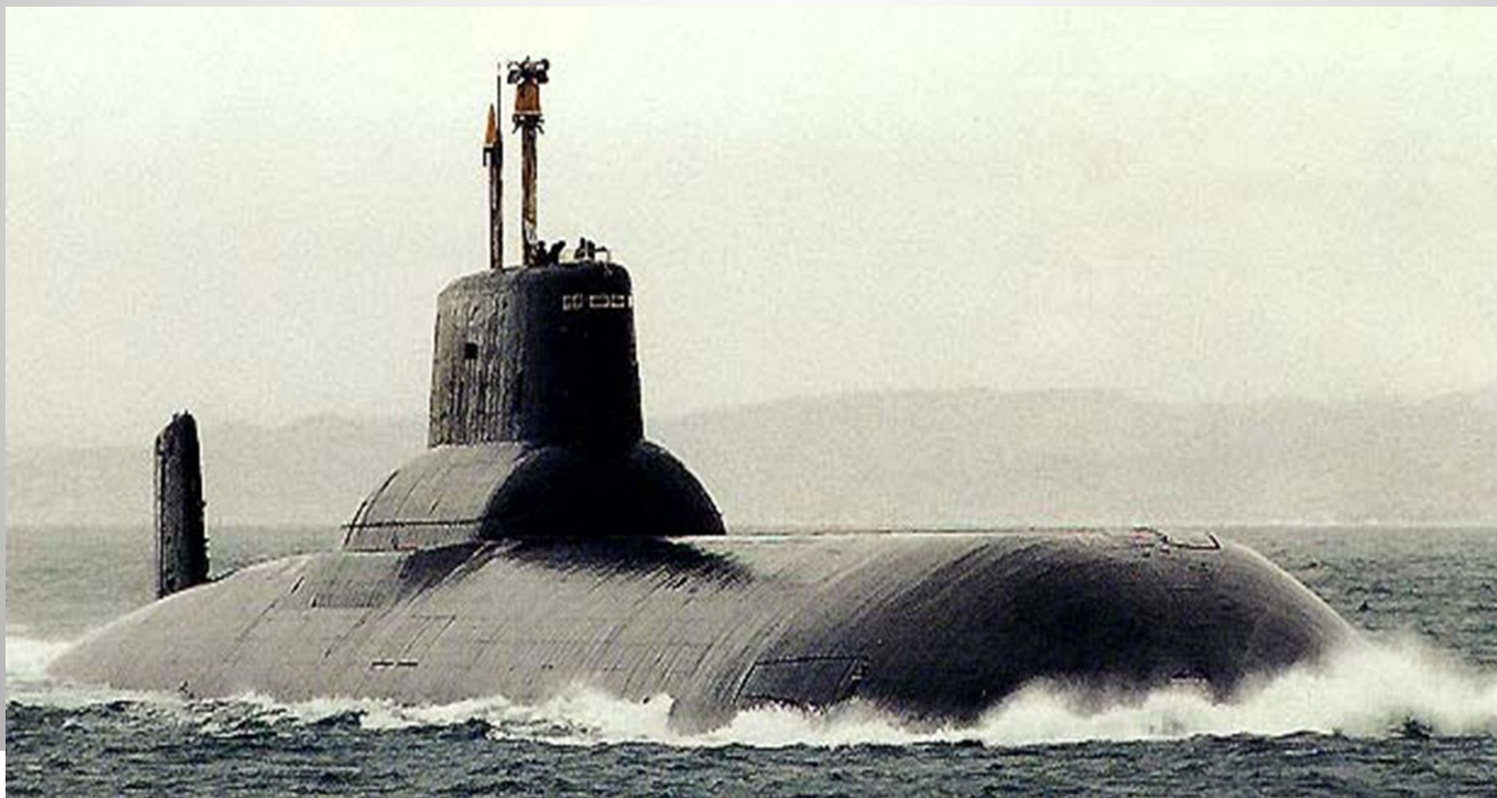
Ракетный Подводный Крейсер(Турпоон - Акула)