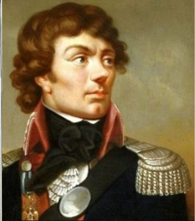
T. Kościuszko 1746 - 1813