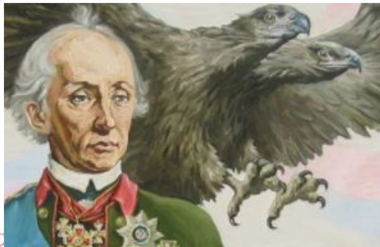
А.В. Суворов 1733-1800 За 1700 суток – 700 вёрст, а как ты получаешь зачёт по ОБЖ?