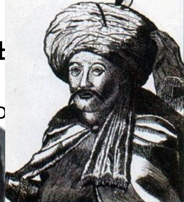
SHAHIN GIREY (Chahin-Girey), welche von Russland 1783 in Besitz genommen worden ist.