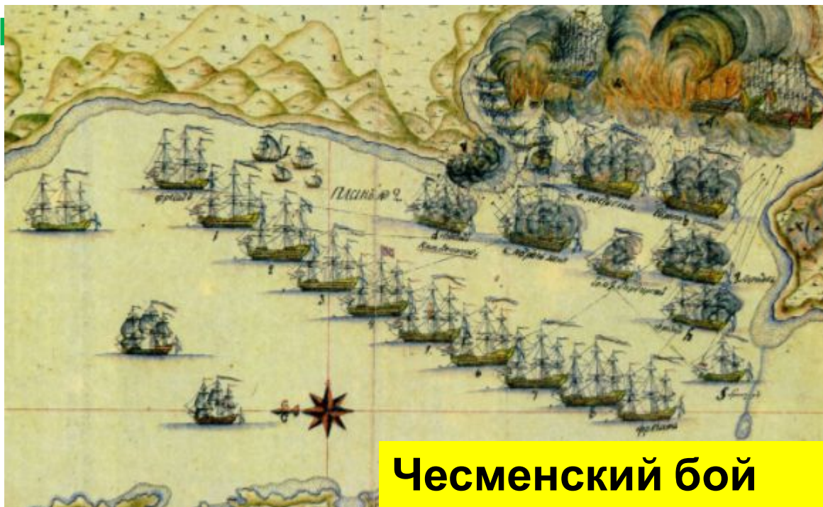
Чесменский бой 1770