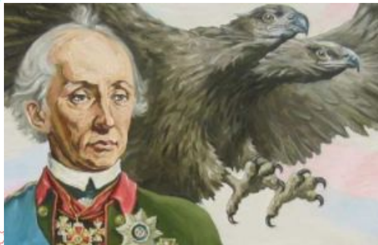
А.В. Суворов 1730-1800 За 170 суток – 700 вёрст, а как ты получаешь зачёт по ОБЖ?