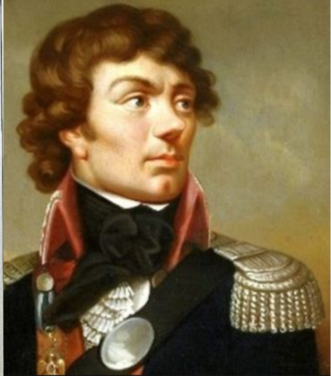
T. Костюшко 1746 - 1813