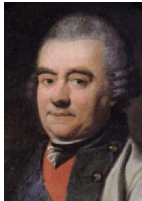
Г.А. Спиридов 1713-1790