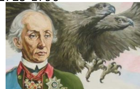
А.В. Суворов 1774 – битва при Козлудже 1730-1800