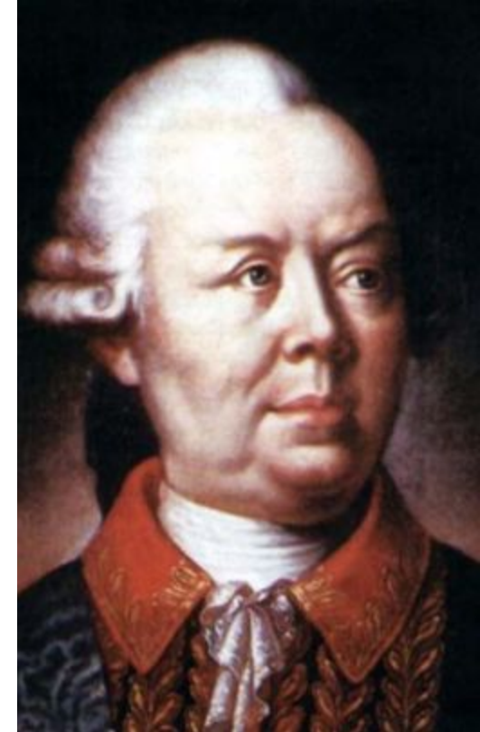
П.А. Румянцев 1725-1796