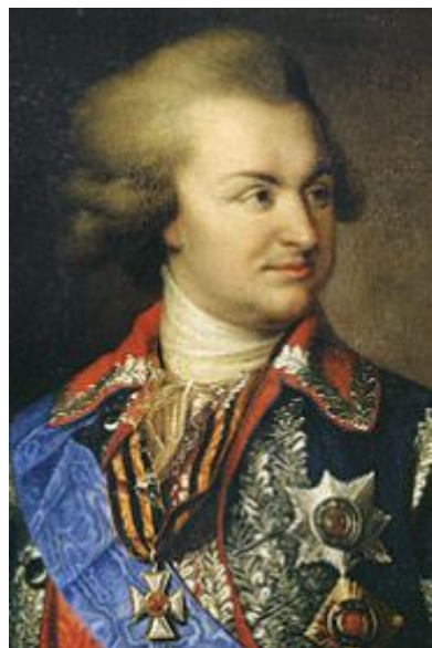
Г.А. Потёмкин 1739-1791

1777 – избрание Шагин-Гирея крымским ханом