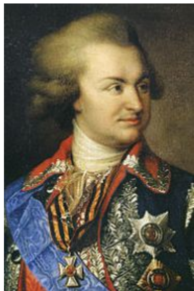
Г.А. Потёмкин 1739-1791

1777 – избрание Шагин-Гирея крымским ханом