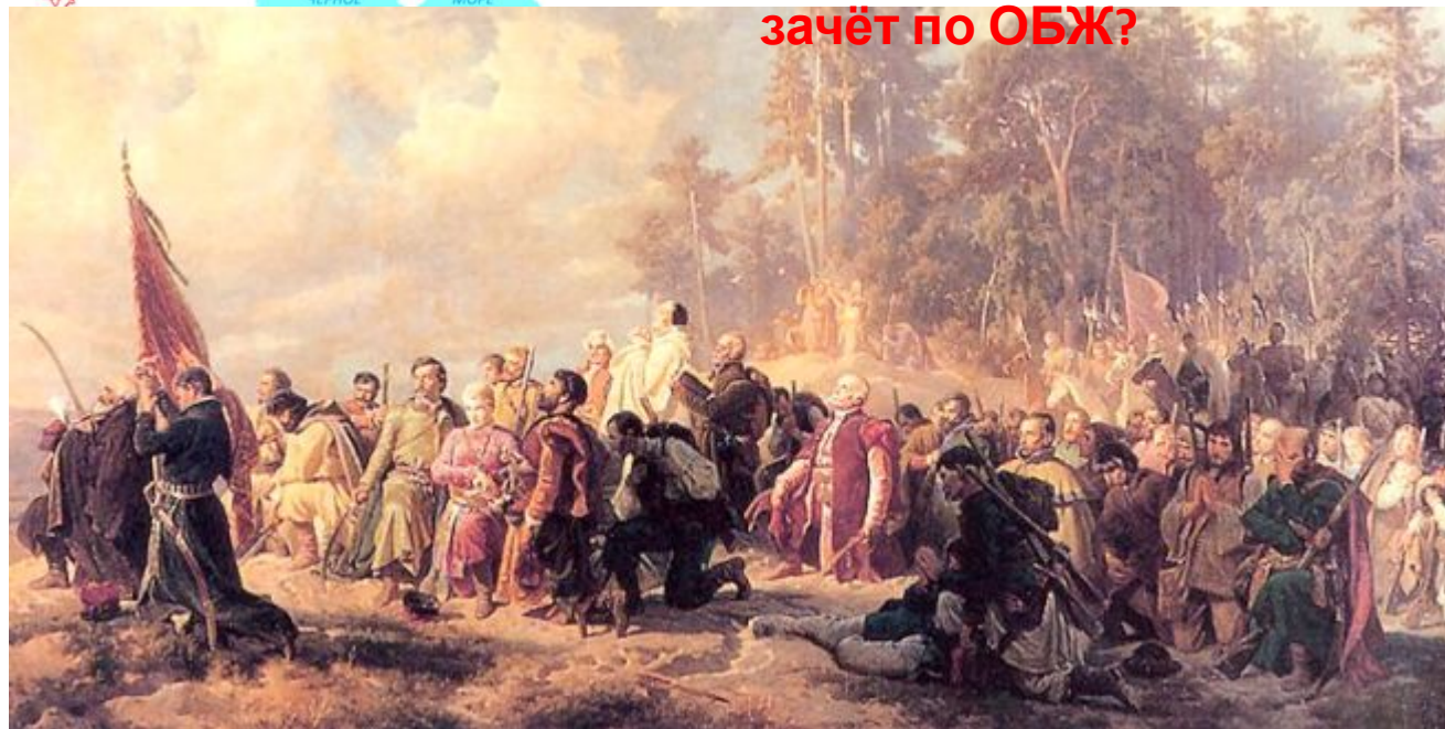
Молитва барских конфедератов