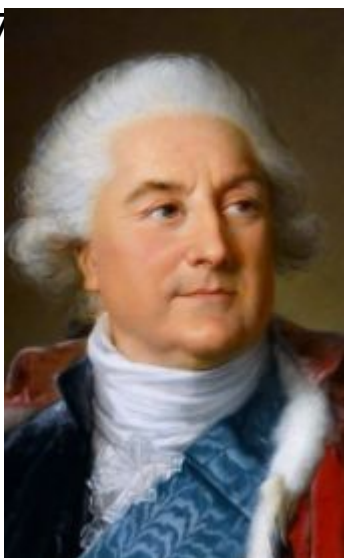
Станислав Понятовский 1763-95