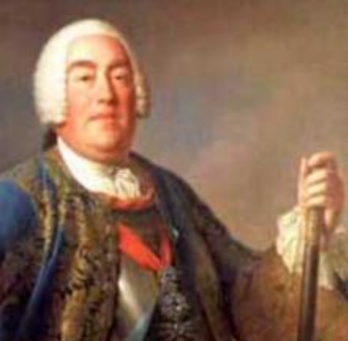
Август III 1734 - 17