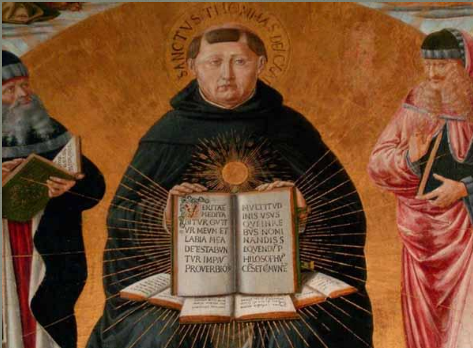
Фома Аквинский : Портал Богослов