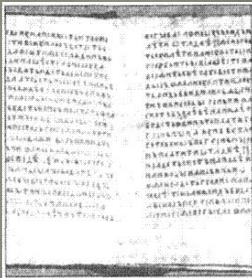
«Капітуля-рій про вілли»