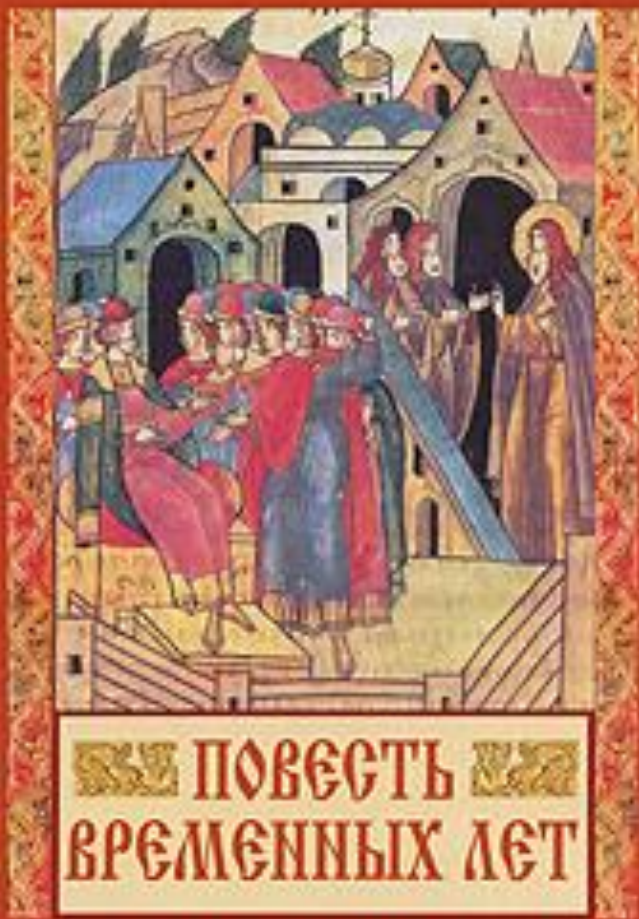
«Повість временних літ»