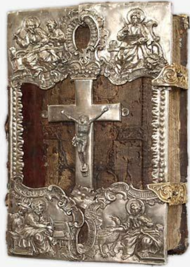
«Апостол» Ивана Федорова. (1564 г.)

Основними джерелами економічної думки середньовічного суспільства є юридичні кодекси й церковні пам'ятки