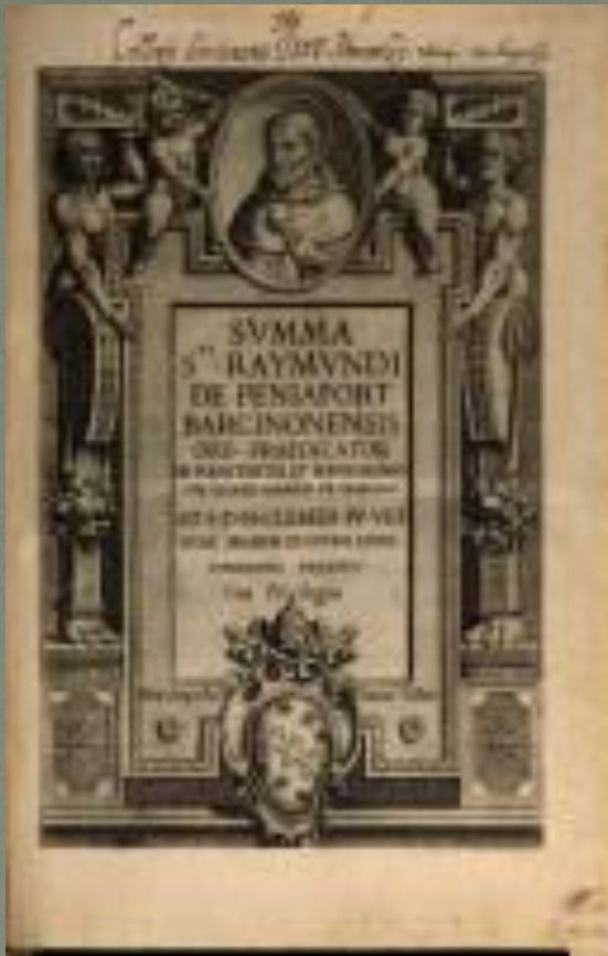
«Сума проти язичників»

В цих книжках Аквінський обстоює централізацію влади, визнає соціальну ієрархію, а її природну підставу бачить у поділі праці, розглядаючи приватну власність як необхідний інститут людського життя.