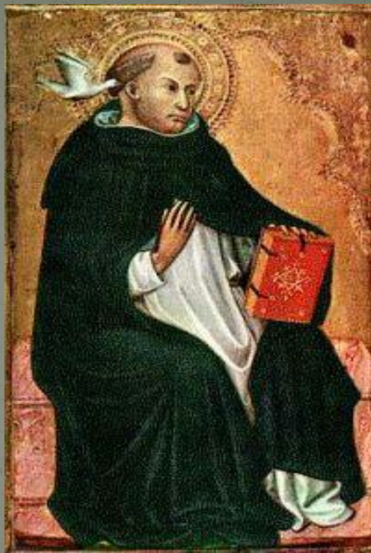
Святий Тома Аквінський