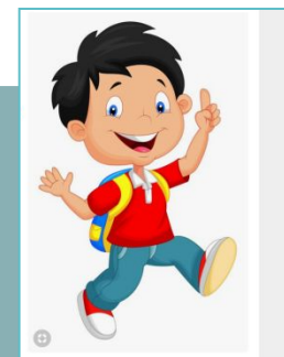
ДОШКОЛЬНИК И, МЛАДШИЕ ШКОЛЬНИКИ