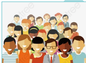
ШИРОКИЕ СЛОИ НАСЕЛЕНИЯ