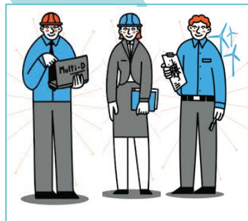
ПРЕДСТАВИТЕЛИ ПРОФЕССИОНАЛЬН ЫХ СООБЩЕСТВ