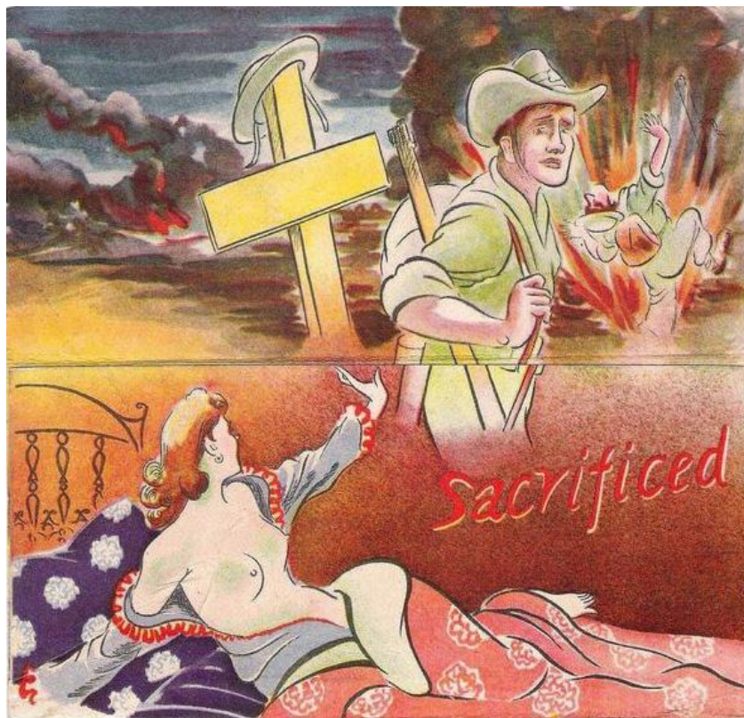
1. «Твое счастье дома - в Австралии!»