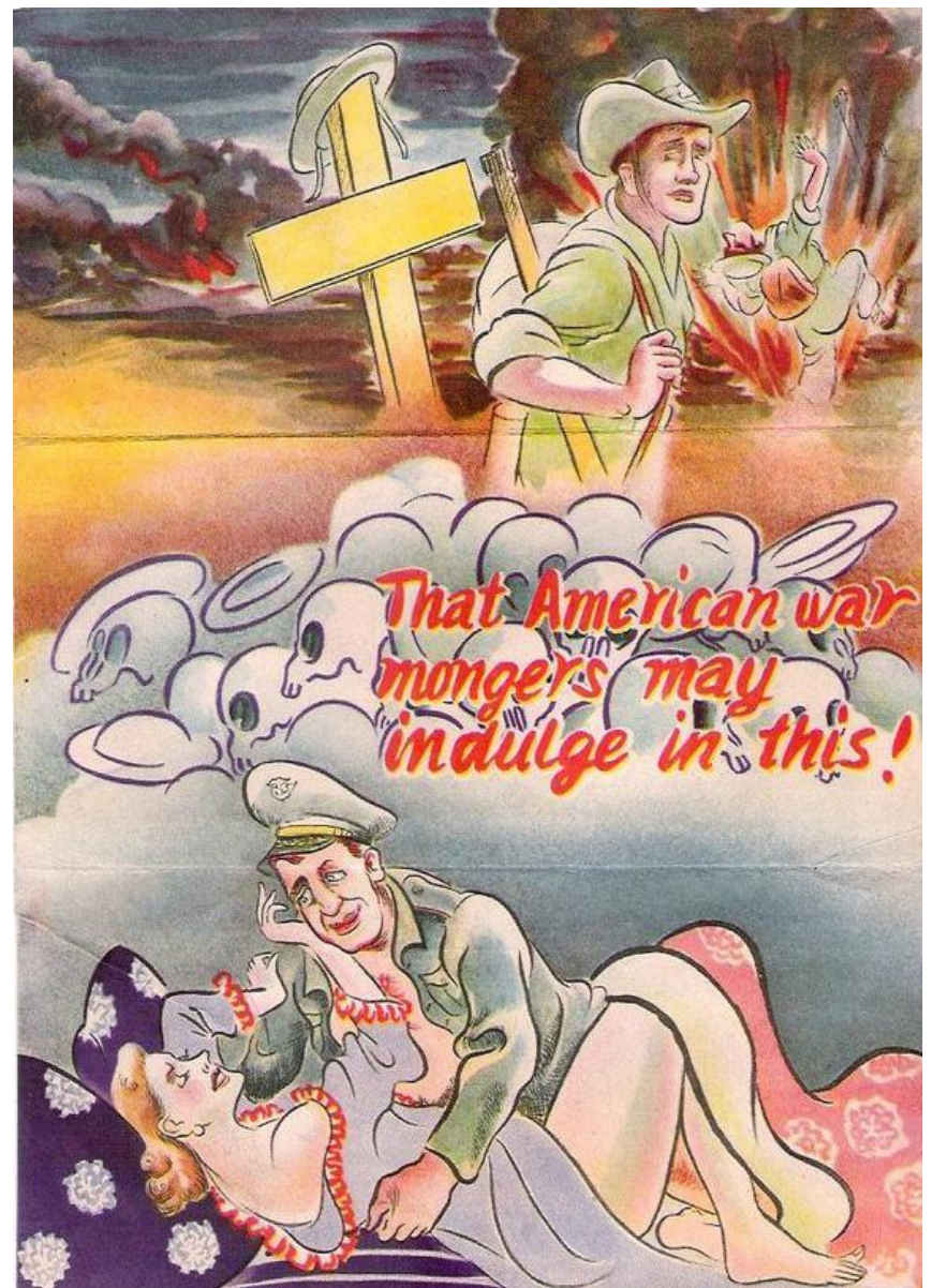
2. "Продолжение" листовки, приведенной выше "Вот чем занимаются американские поджигатели войны"