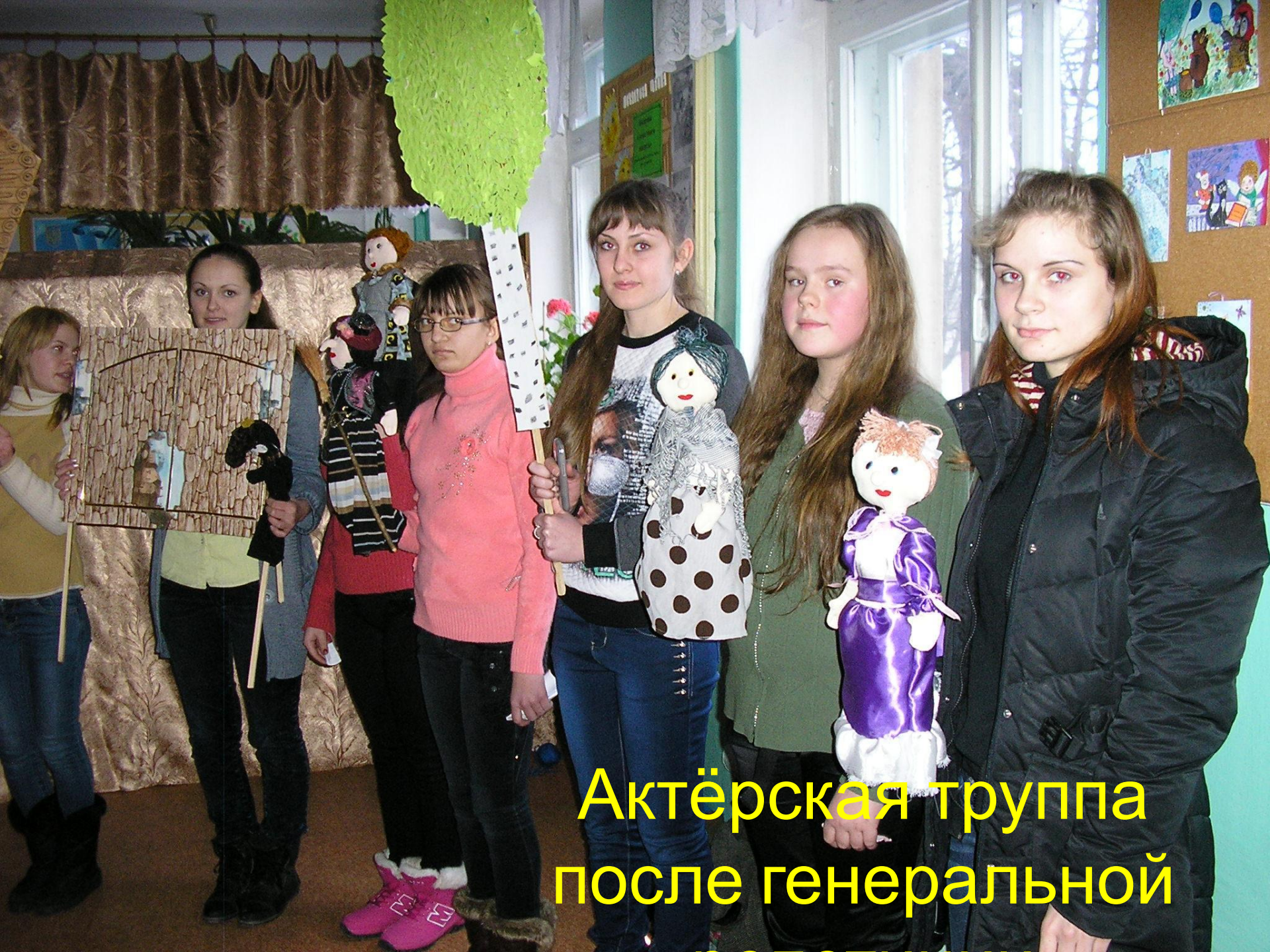
Актёрская труппа после генеральной