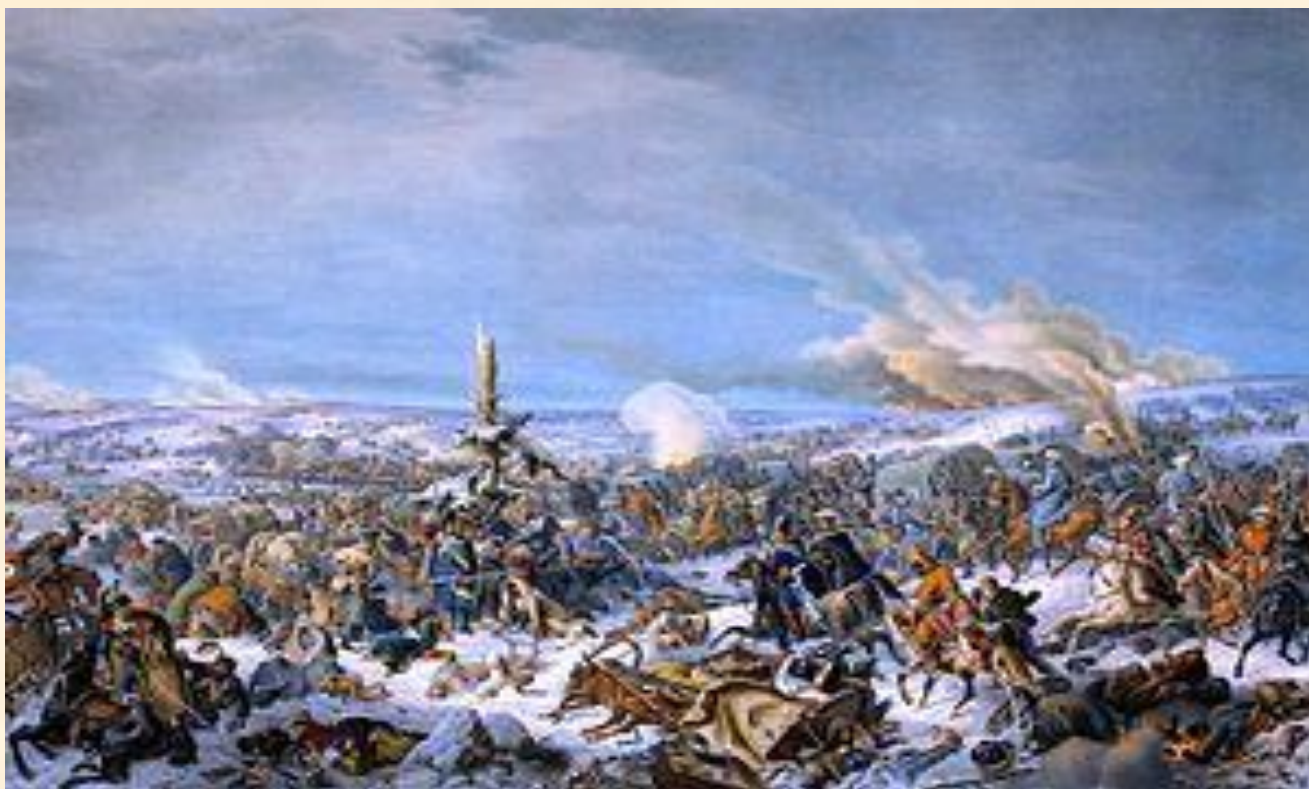
Сражение на Березине