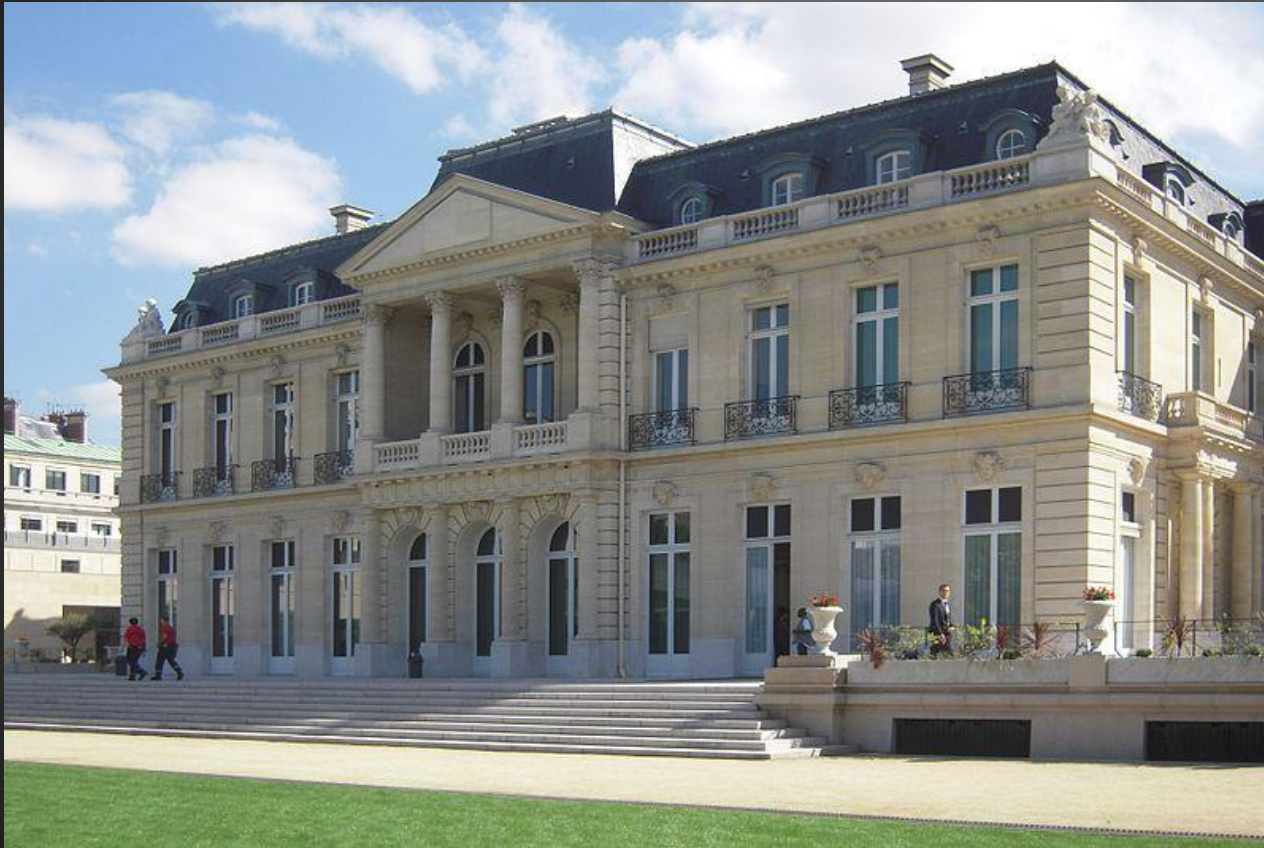
Château de la Muette