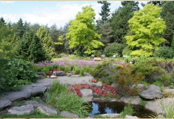
Ботанический сад ННГУ имени Н. И. Лобачевского