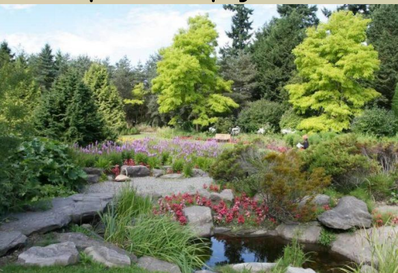
Ботанический сад ННГУ имени Н. И. Лобачевского