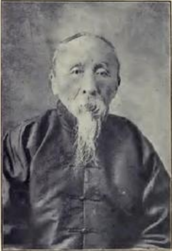
General Zhao Erh-sun