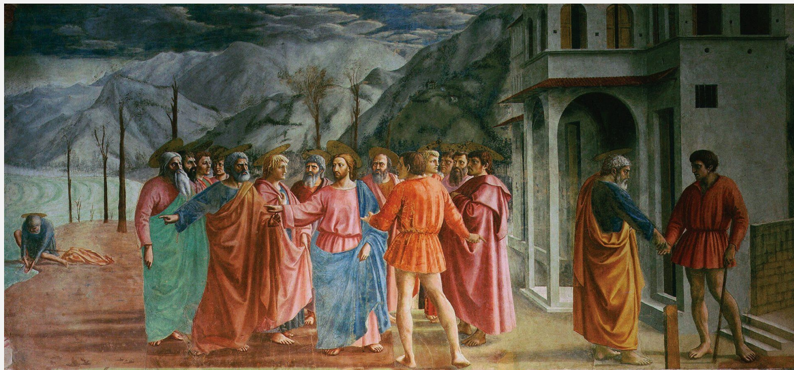
Чудо со статиром. 1426-27