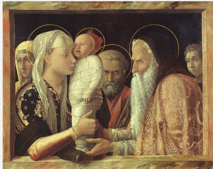
Сретение. Ок. 1453