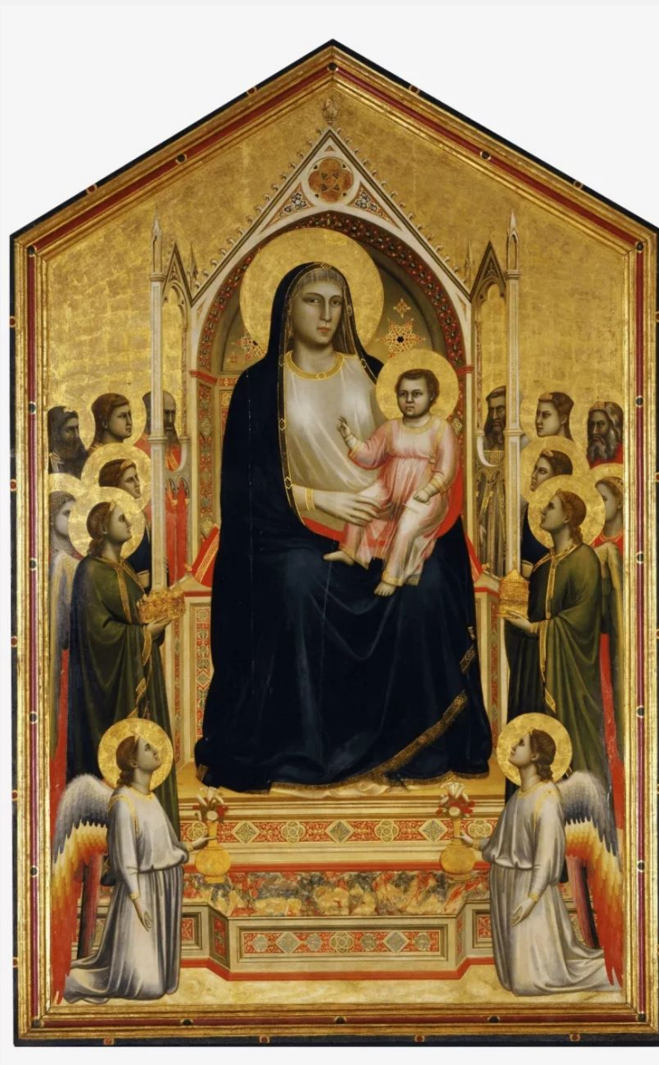
Мадонна Онъисанти, 1310