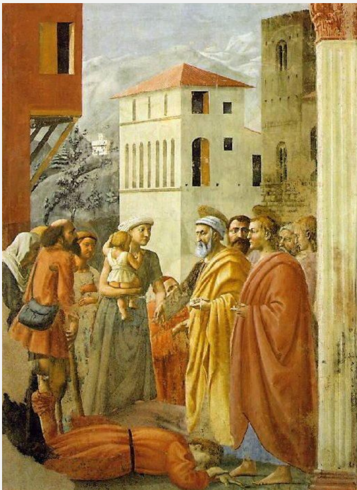
Пётр, распределяющий имущество общины между бедными, смерть Анании и Саффиры. 1426-27