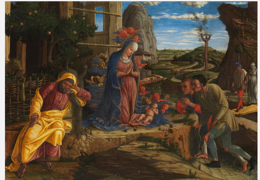
Поклонение пастухов. После 1450