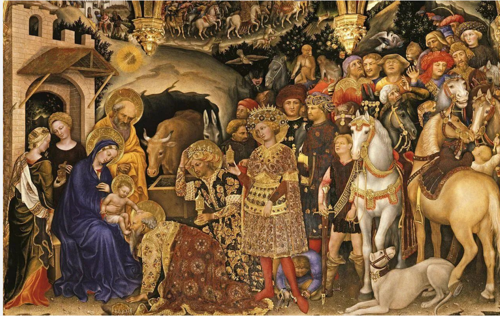
Поклонение волхвов. Джентиле да Фабриано, 1423