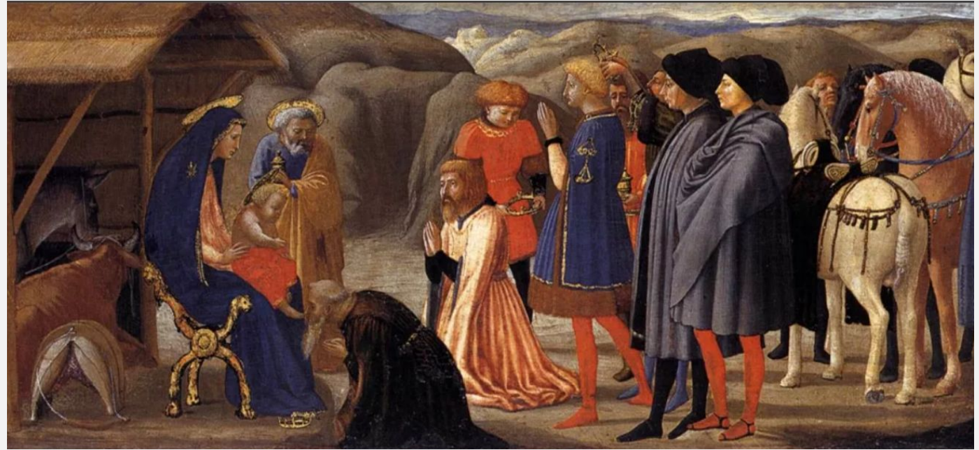
Поклонение волхвов. Мозаччо, 1426