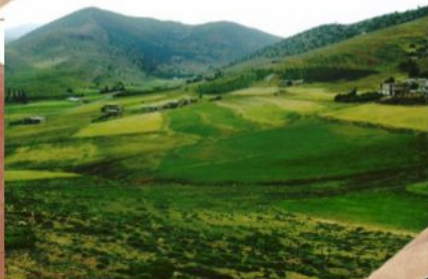
Национальный парк "Ахаггар"