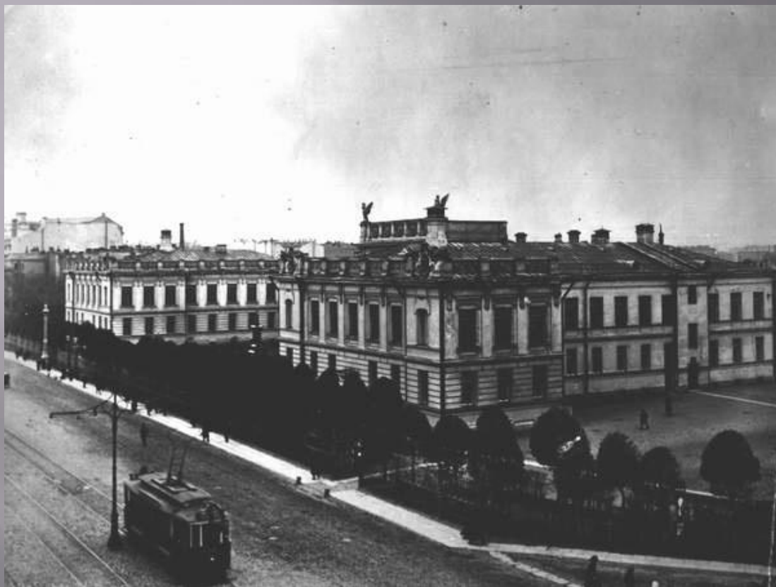
Николаевская военная академия 1830