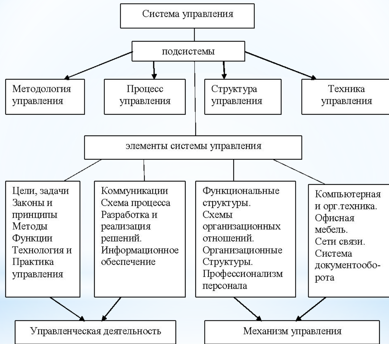
Рисунок 1 – Схема системы управления предприятием