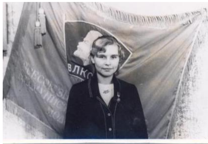
1976 год, февраль. Подписан Рапорт 25 съезду КПСС. Частинский РК ВЛКСМ