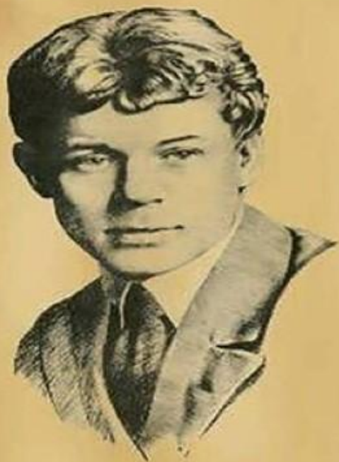
С. А. Есенин

Вечером синим, вечером лунным Был я когда-то красивым и юным. Неудержимо, неповторимо Все пролетело. Далече... мимо... Сердце остыло, и выцвели очи... Синее счастье! Лунные ночи!