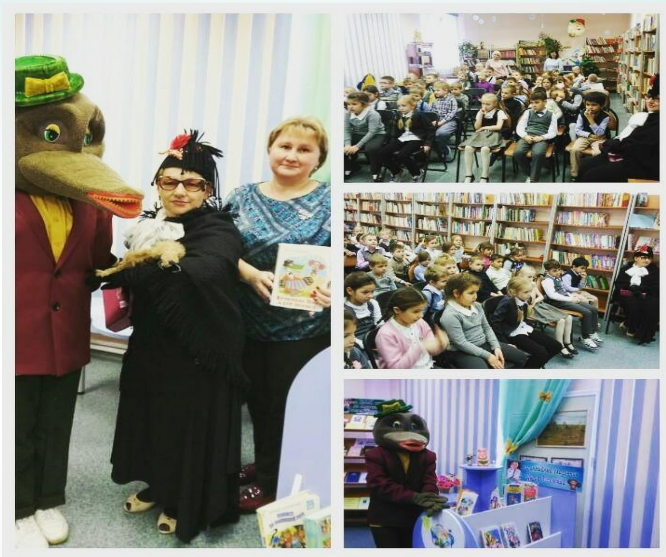
Театральное шоу «Дружная семейка Эдуарда Успенского»