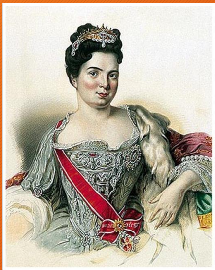
ЕКАТЕРИНА жена Петра I