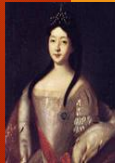
АННА дочь Петра I