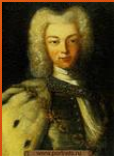
ПЕТР внук Петра I