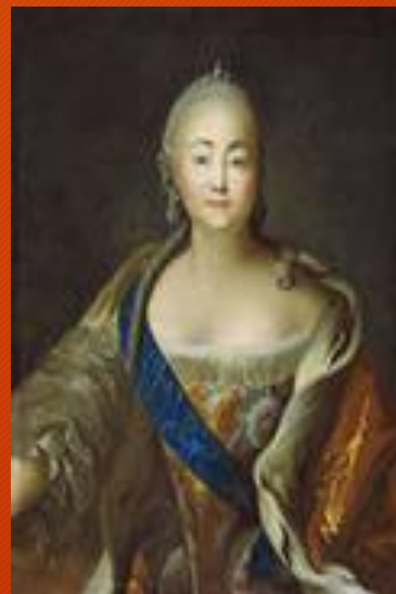
ЕЛИЗАВЕТА дочь Петра I