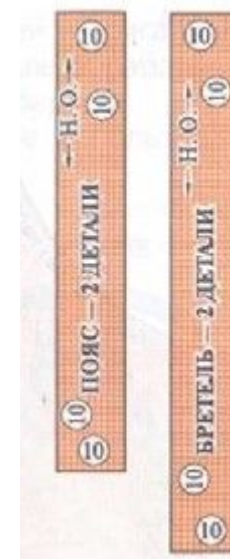
Пояски и бретели