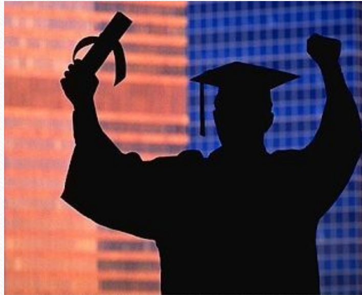
Болонский процесс: путь из Европы.