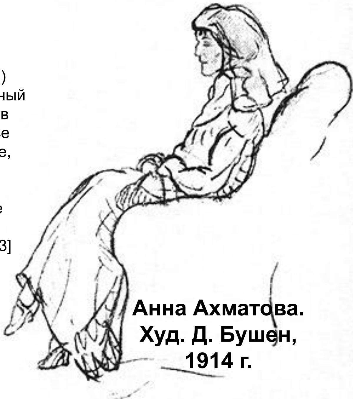
Анна Ахматова. Худ. Д. Бушен, 1914 г.

Анне Ахматовой В начале века профиль странный (Истончен он и горделив) Возник у лиры. Звук желанный Раздался, остро воплотив Обиды, горечь и смятенье Сердце, выдавших острие, Где в неизбежном столкновеньи Два века бились за свое . С. Городецкий, [1911-1913]