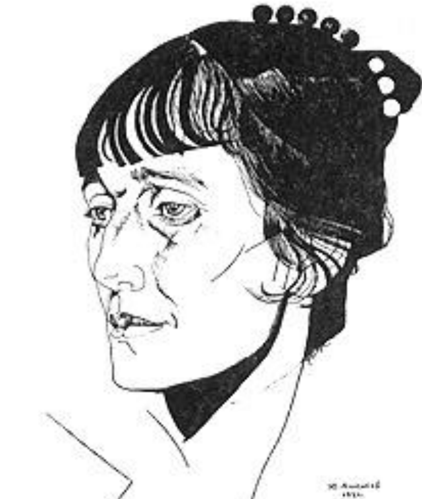
Анна Ахматова. Худ. Ю. Анненков, 1921 г.

Ахматова – жасминный куст, Обожженный асфальтом серым, Тропу утратила ль к пещерам, Где Данте шел и воздух густ И нимфа лен прядет хрустальный? Средь русских женщин Анной дальней Она, как облачко, сквозит Вечерней проседью раки!