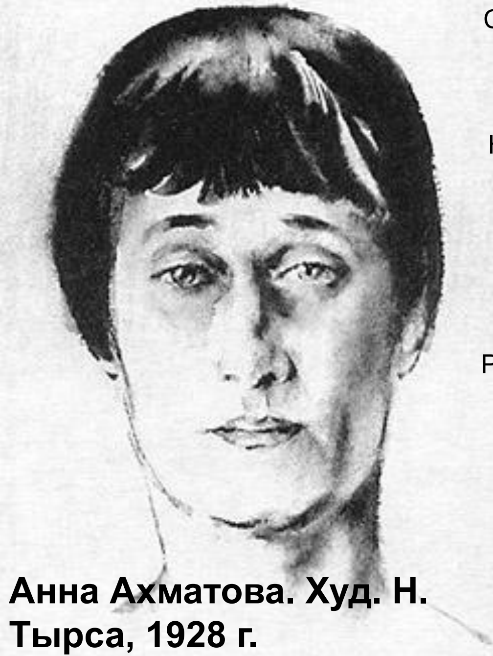
Анна Ахматова. Худ. Н. Тырса, 1928 г.

Законодательным скучая взором, Сквозь невниманье, ленью угнетен, Как ровное жужжанье веретен, Я слышал голоса за дряблым спором.