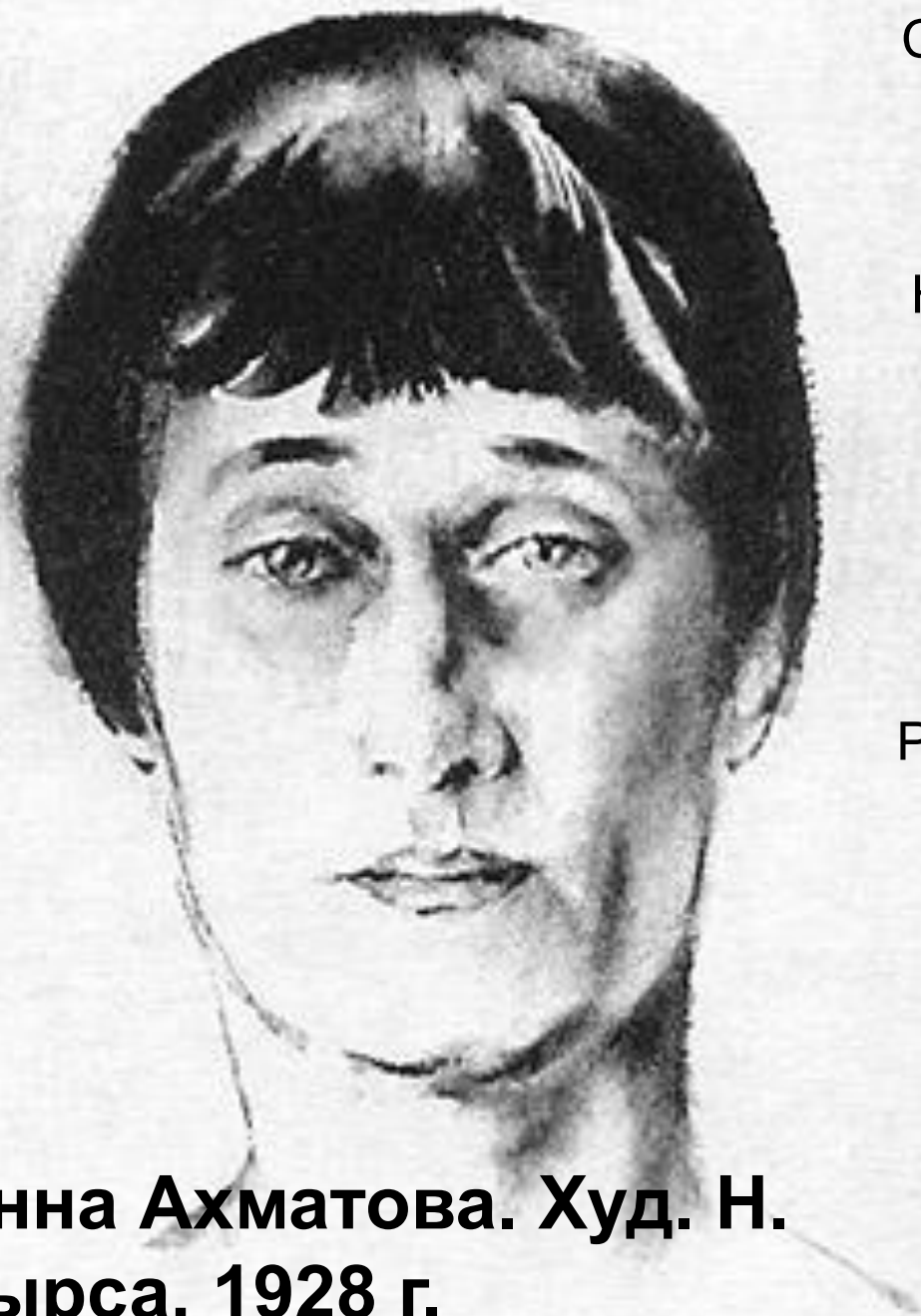
Анна Ахматова. Худ. Н. Тырса, 1928 г.

Законодательным скучая взором, Сквозь невниманье, ленью угнетен, Как ровное жужжанье веретен, Я слышал голоса за дряблым спором.