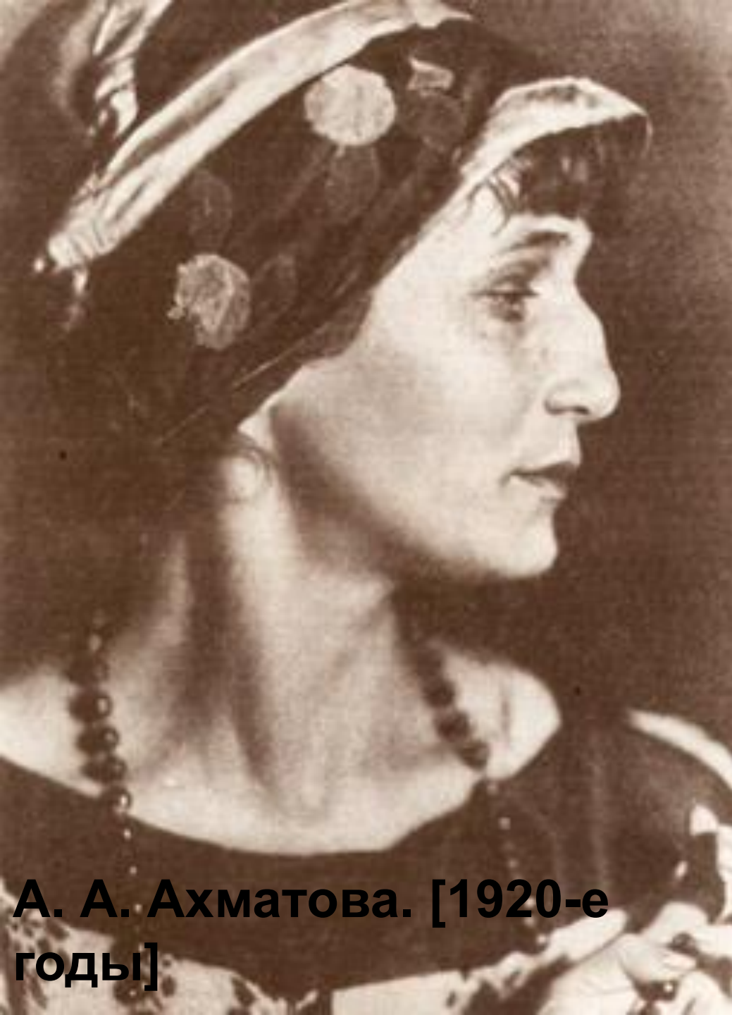
А. А. Ахматова. [1920-е годы]