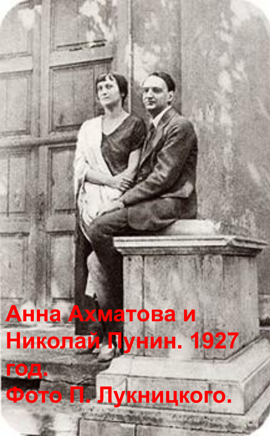
Анна Ахматова и Николай Пунин. 1927 год.

На шее мелких четок ряд, В широкой муфте руки прячу, Глаза рассеянно глядят И больше никогда не плачут. И кажется лицо бледней От лиловеющего шелка, Почти доходит до бровей Моя не завитая челка. И не похожа на полет Походка медленная эта, Как будто под ногами плот, А не квадратики паркета! А бледный рот слегка разжат, Неровно трудное дыханье, И на груди моей дрожат Цветы не бывшего свиданья.