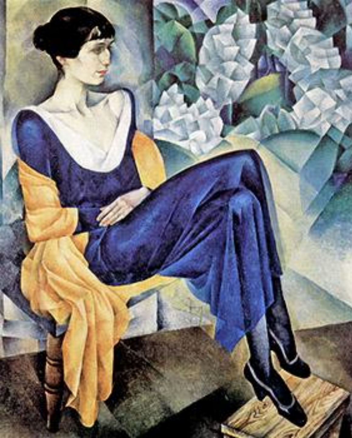
Портрет Анны Ахматовой. Худ. Н. Альтман, 1915 г.