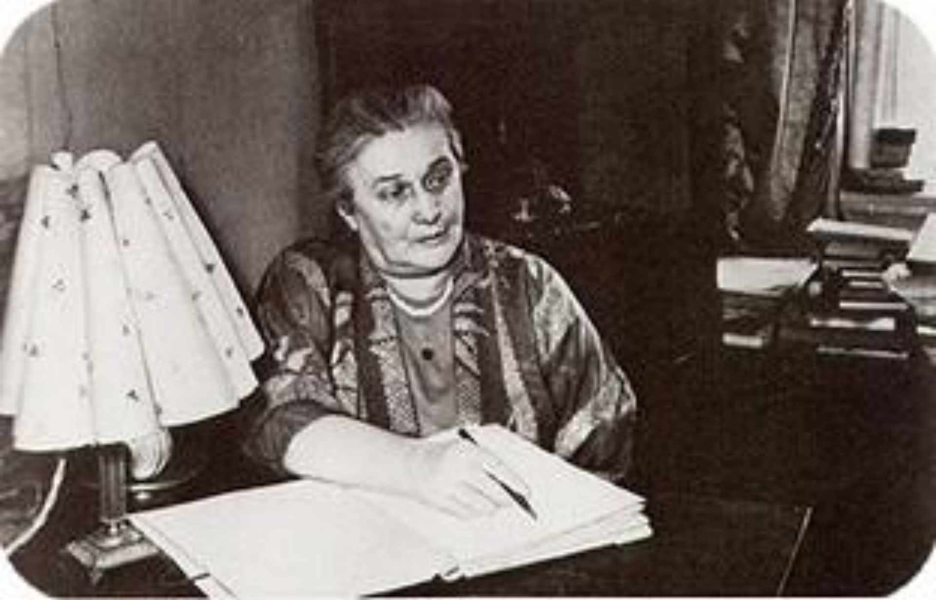
Анна Ахматова в своем рабочем кабинете. Конец 50-х годов.