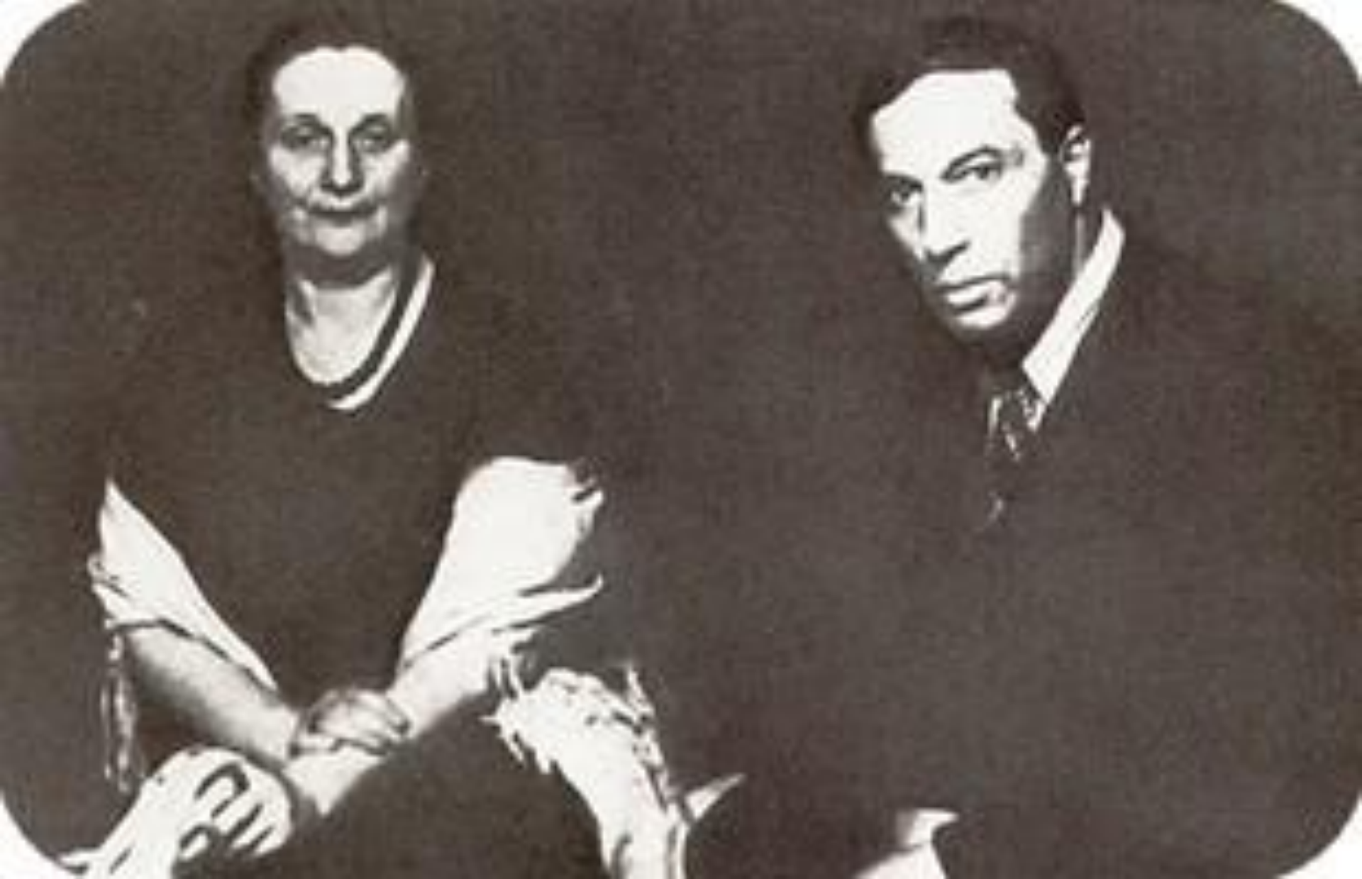
Анна Ахматова и Борис Пастернак. Весна 1946 года.