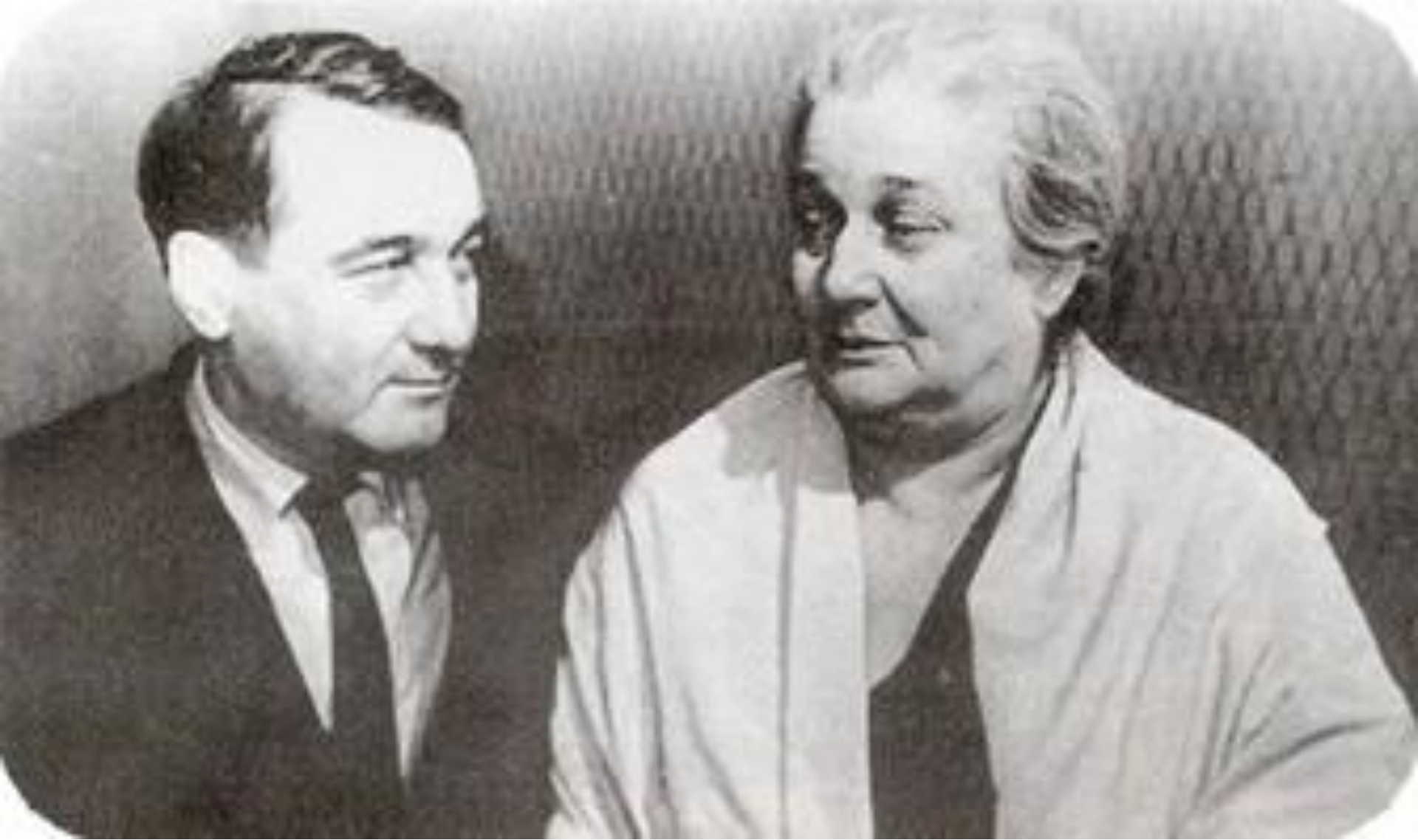
А. А. Ахматова и Л. Н. Гумилев. 1960 год.