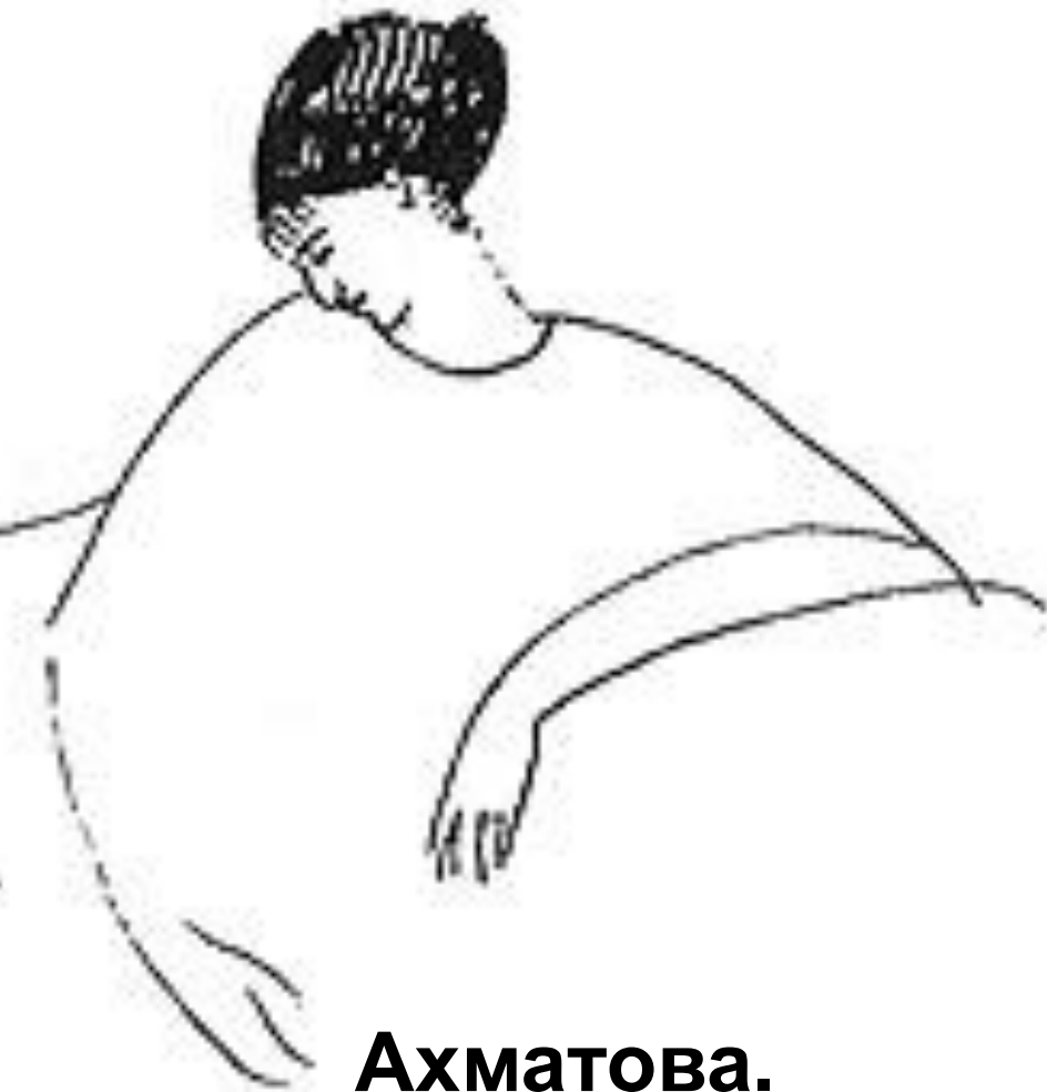
Ахматова. Рис. А. Модильяни. Париж, 1911 г.