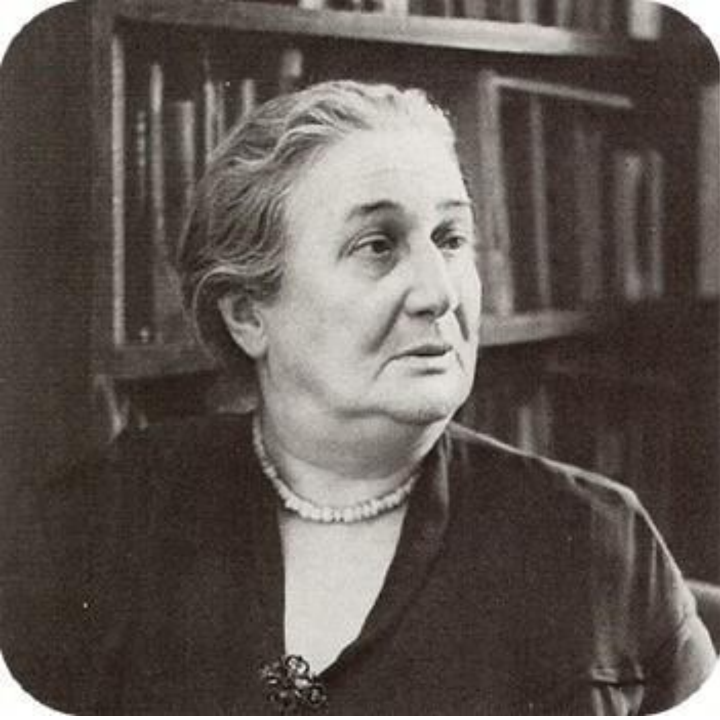
Анна Ахматова. Начало 1960-х годов.