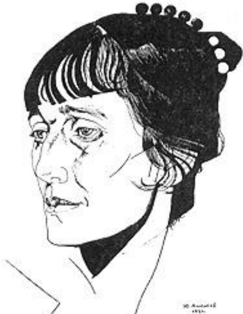
Анна Ахматова. Худ. Ю. Анненков, 1921 г.

Ахматова – жасминный куст, Обожженный асфальтом серым, Тропу утратила ль к пещерам, Где Данте шел и воздух густ И нимфа лен прядет хрустальный? Средь русских женщин Анной дальней Она, как облачко, сквозит Вечерней проседью раKIT!