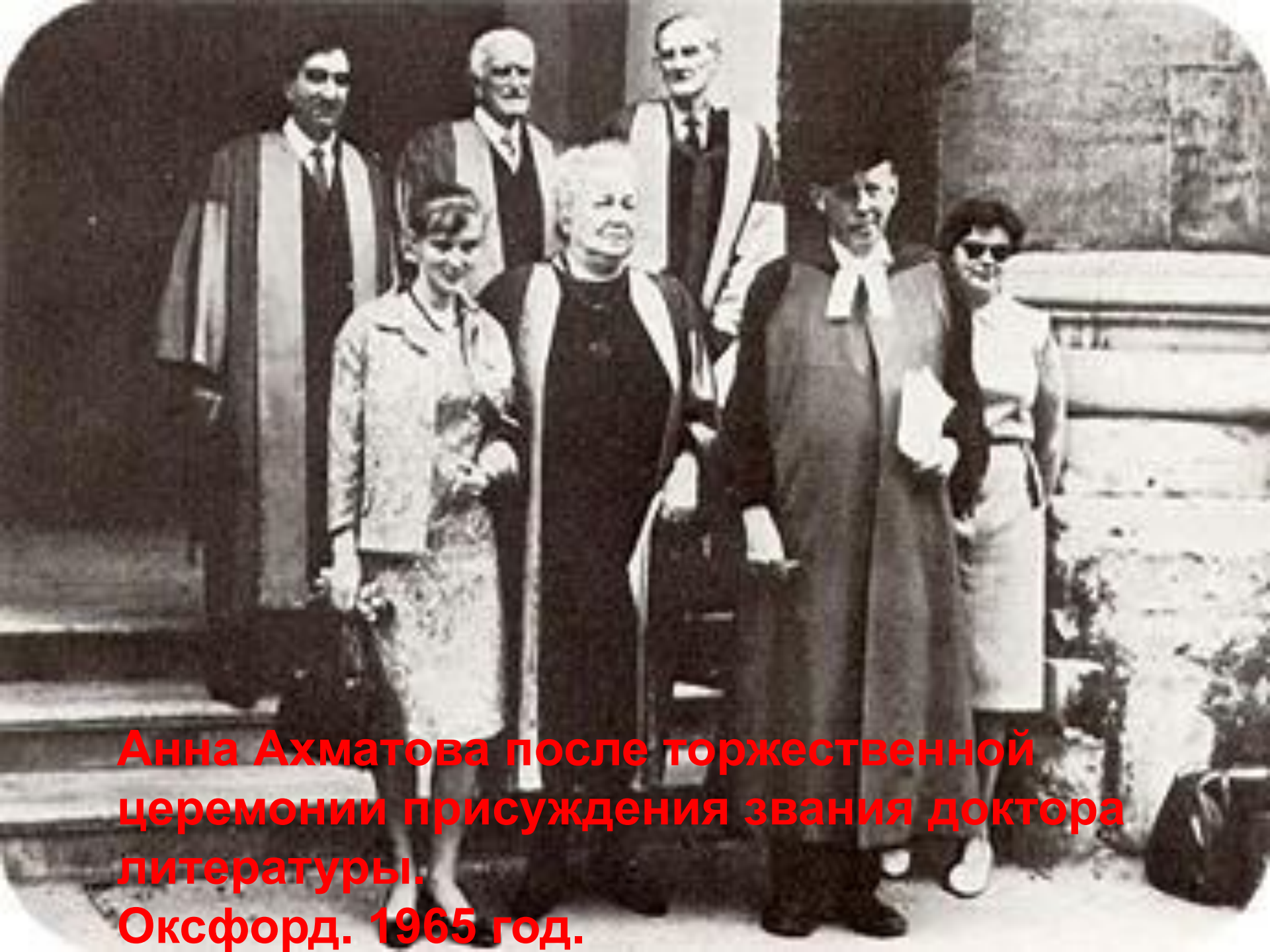
Анна Ахматова после торжественной церемонии присуждения звания доктора литературы. Оксфорд. 1965 год.