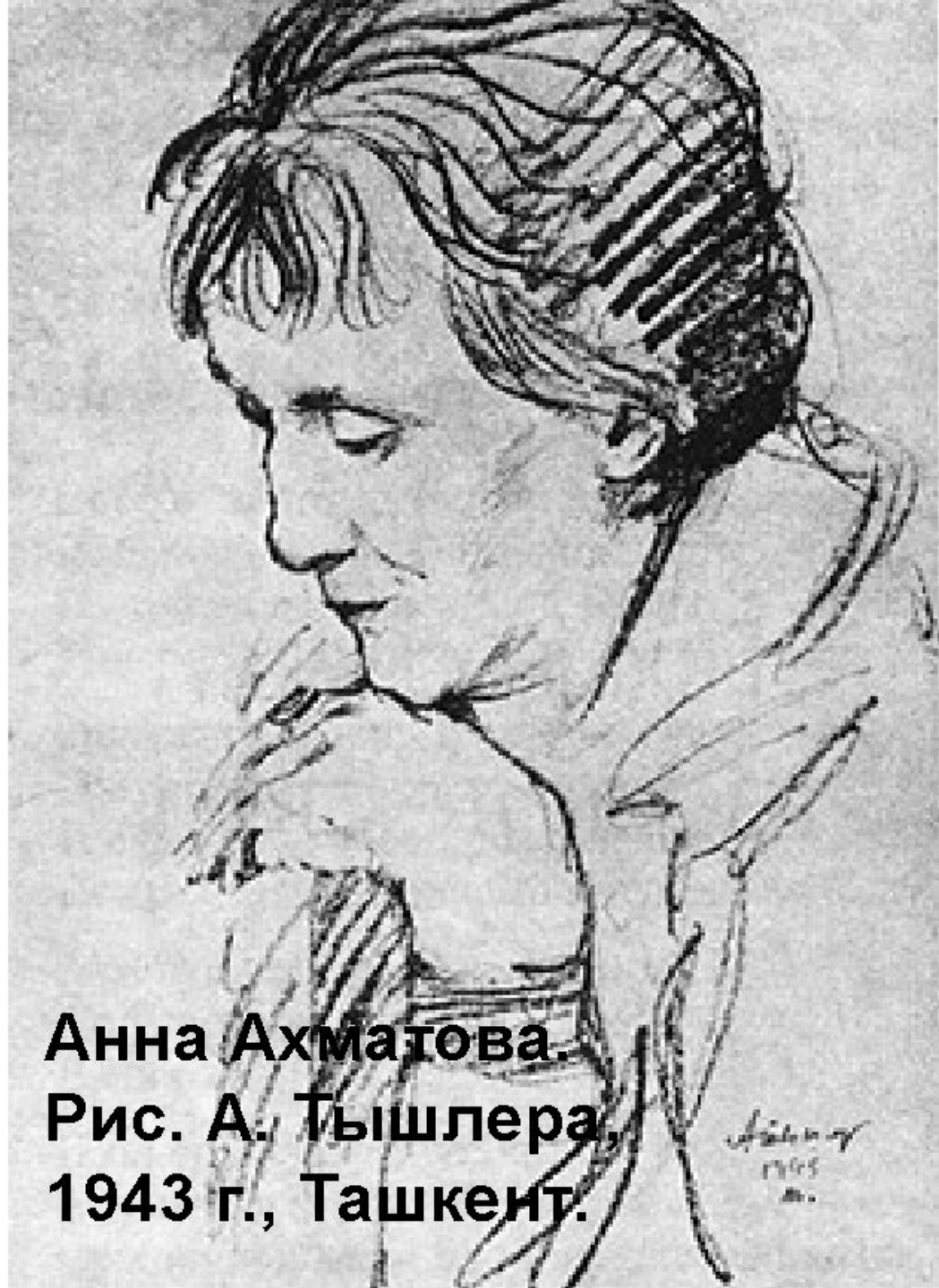
Анна Ахматова. Рис. А. Тышлера, 1943 г., Ташкент.