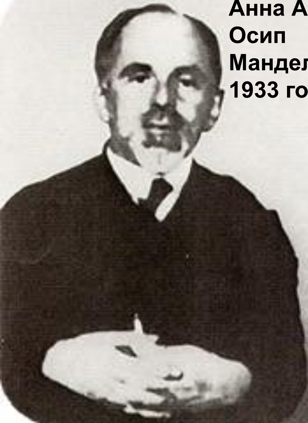
Анна Ахматова и Осип Мандельштам. 1933 год.