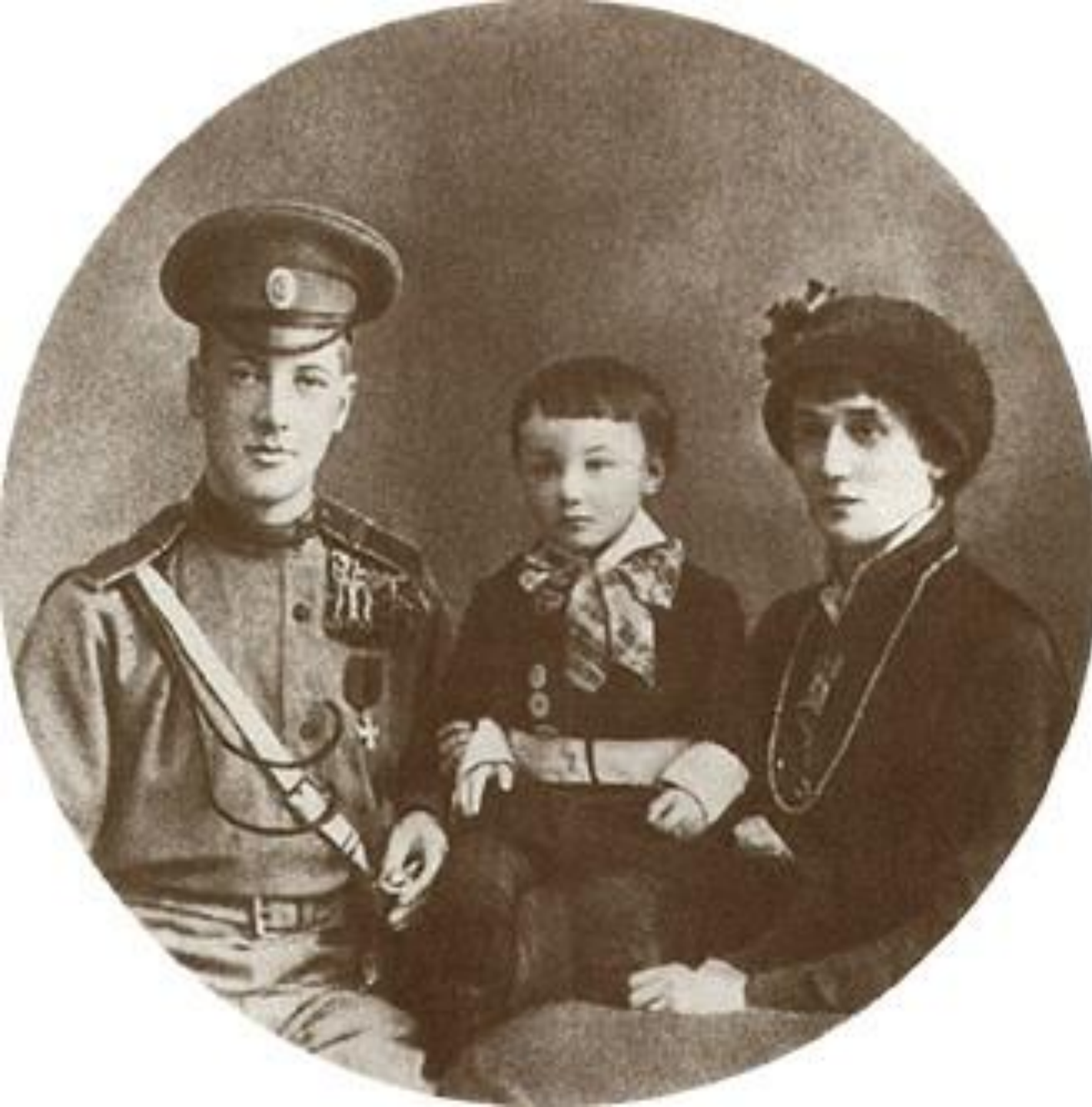
Анна Ахматова и Николай Гумилев с сыном Левой. 1915 год.