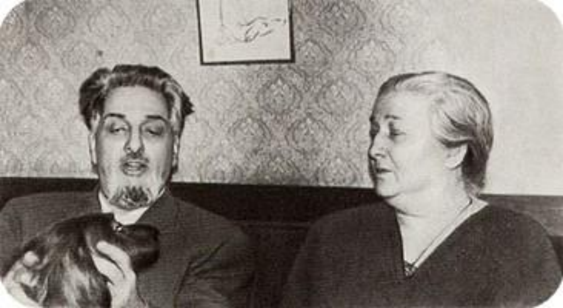
Анна Ахматова и Виктор Ардов. Конец 50-х годов.