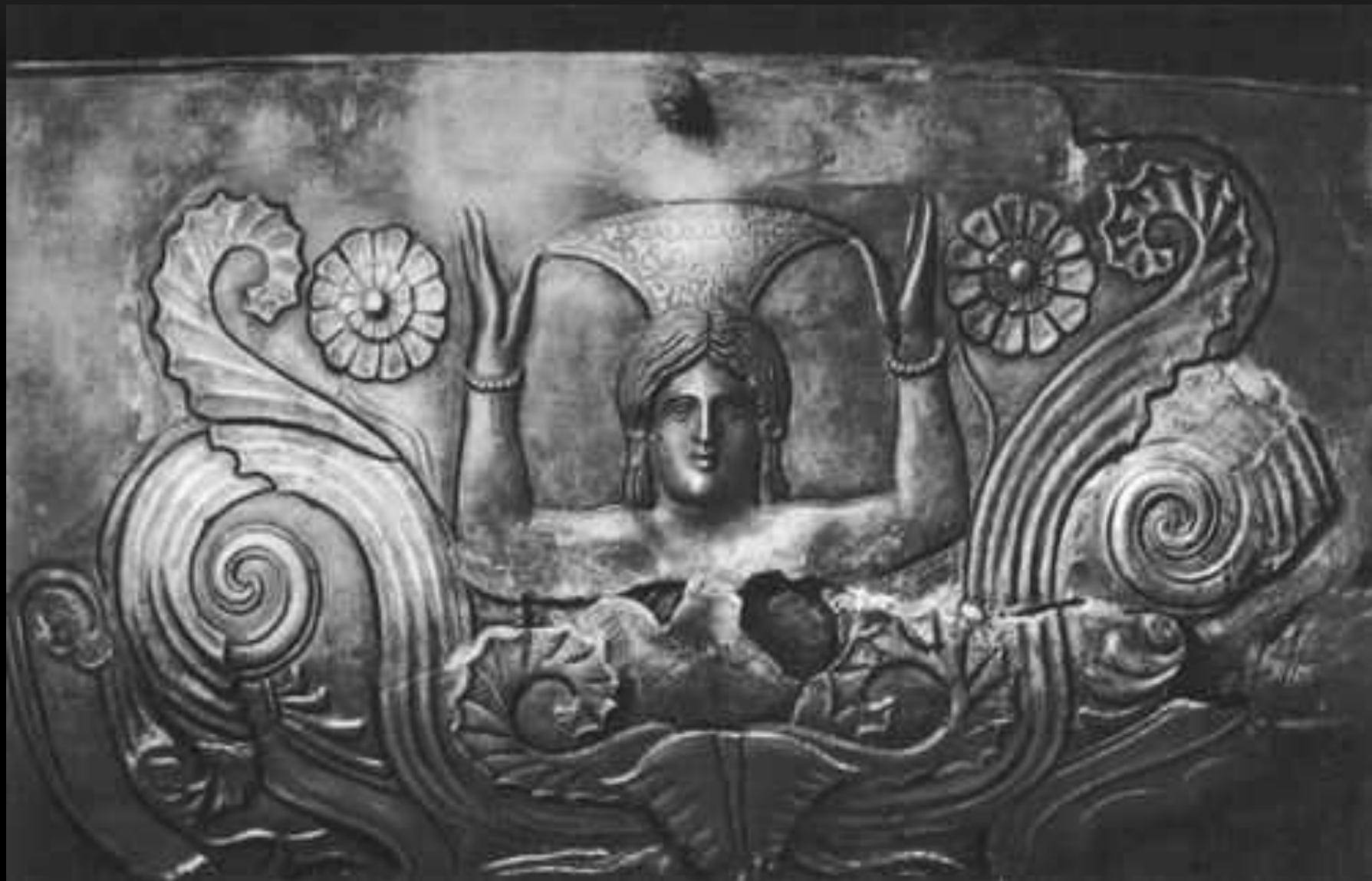
Скіфська богиня любові Аргимпаса. Зображення на вазі з кургану Чортомлик. Нікопольський район