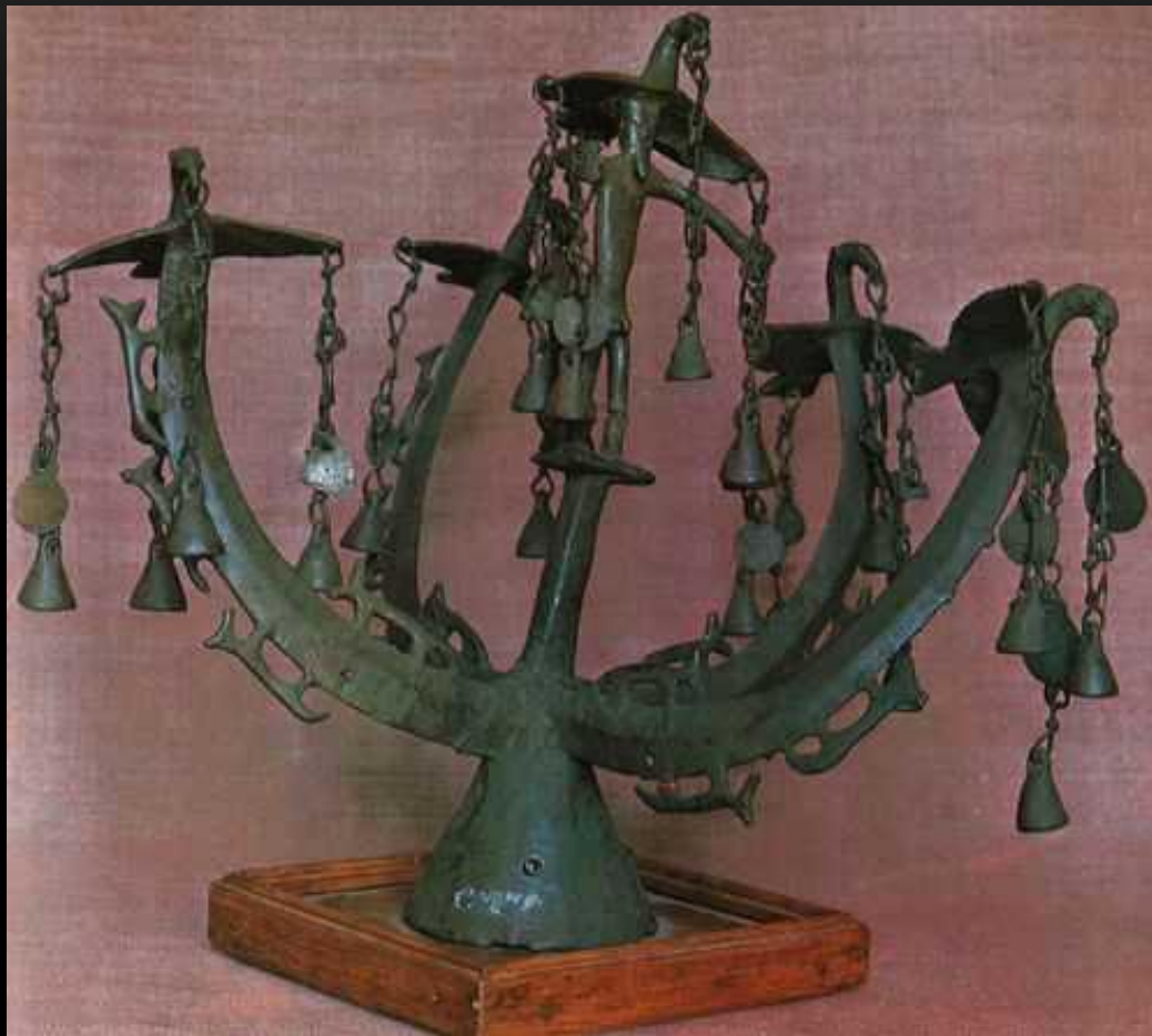
Бронзове навершя із зображенням бога Папая. Урочище Лиса Гора. Дніпропетровська область