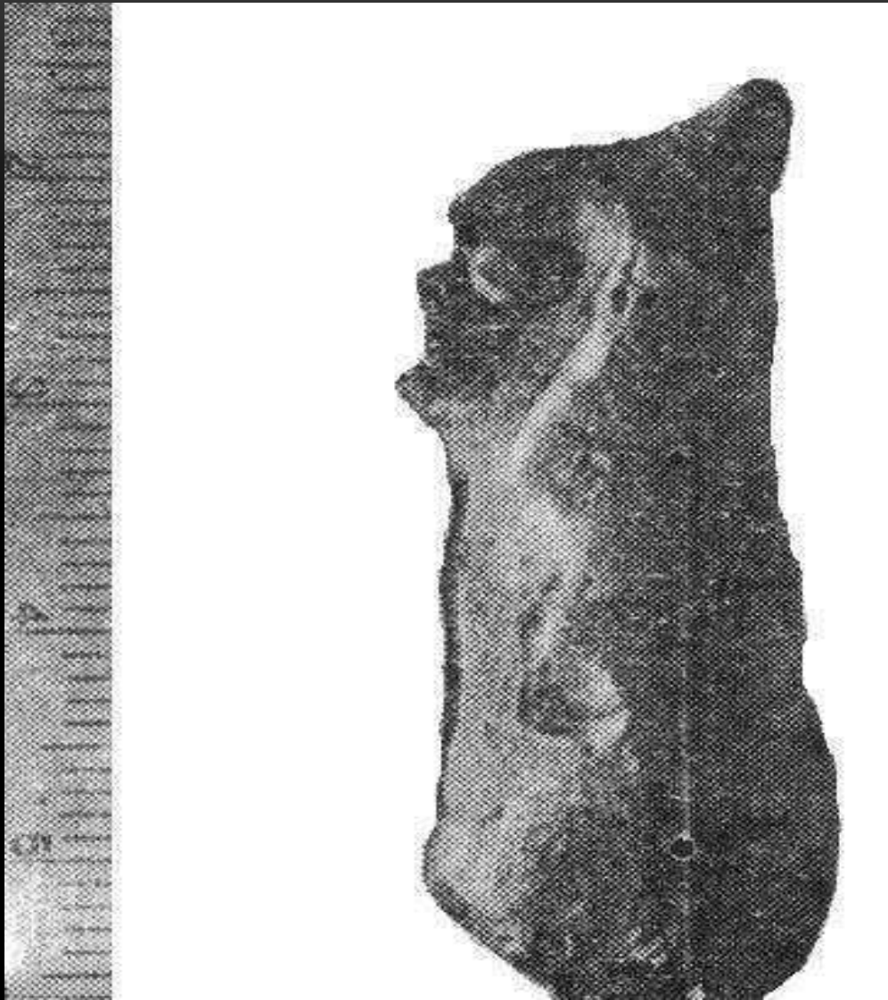
Скіфський глиняний божок. Знахідка на зольнику у Криму