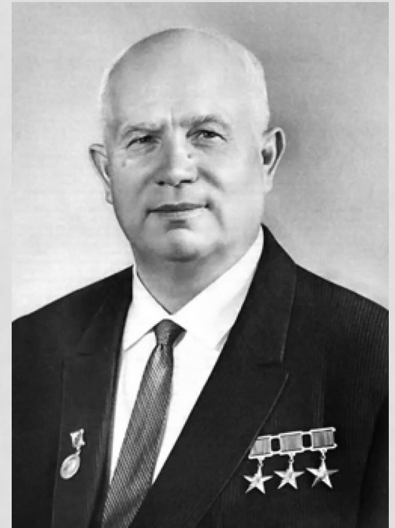
Н. С. Хрущев

Глава МВД, включившего в свой состав МГБ; Первый заместитель Председателя Совета Министров