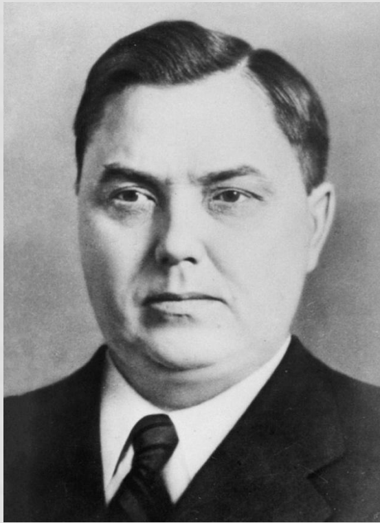
Г. М. Маленков