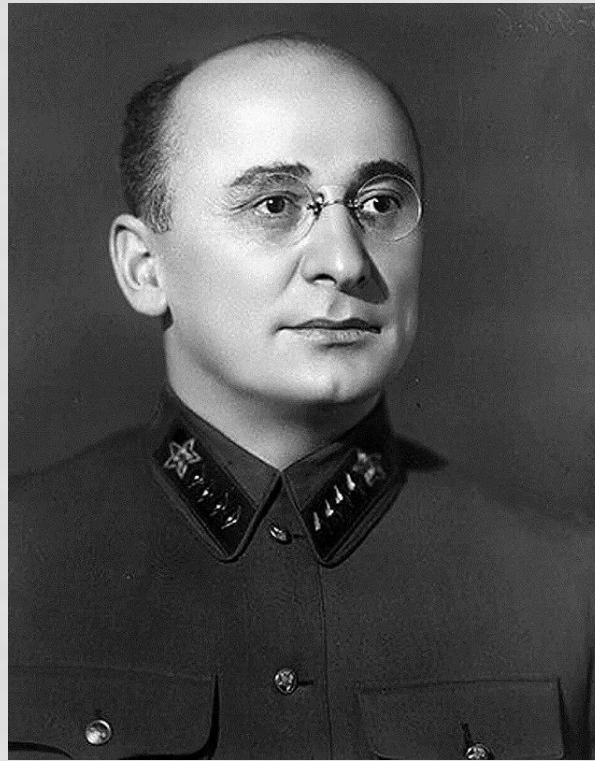
Л. П. Берия

Глава МВД, включившего в свой состав МГБ; Первый заместитель Председателя Совета Министров